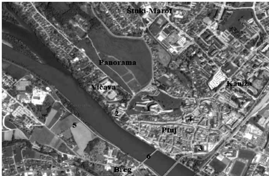
Slika 1: Ptuj z mikrolokacijami: tri oporne točke (1 – grad; 2 – dominikanski samostan; 3 – minoritski samostan) in tri »predmestja« (Vičava, Kaniža, Breg); 4 – proštjska cerkev; 5 – predvidena lokacija rimskega mostu; 6 – lokacija poznosrednjeveškega in novoveškega mostu.

razvila »trikotna« naselbina; na izpostavljenih točkah so stali dominikanski in minoritski samostan ter grad. Grajski kompleks ni bil ločen od mesta, nanj se je lahko dostopalo tudi z južne strani. Tukaj so prebivali Slovani, Germani/Nemci/Bavarci in Judje. Sredi 13. stoletja so mesto obdali z obzidjem, s čimer je nastal relativno zaključen urbani organizem, ki se vse do pred kratkim ni bistveno širil, ampak samo dopolnjeval in gradbeno prilagajal stilnim spremembam. 5