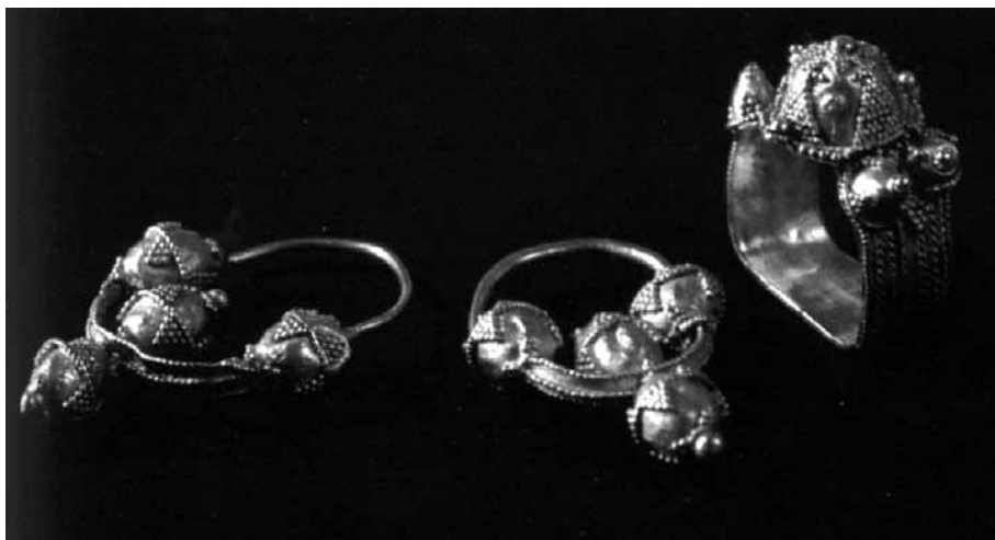
Slika 3: Zlate najdbe iz groba 355; Paola Korošec je prstan pripisala Metodu. 66

Fig. 3: Golden finds from grave 355; Paola Korošec ascribed the ring to Methodius.