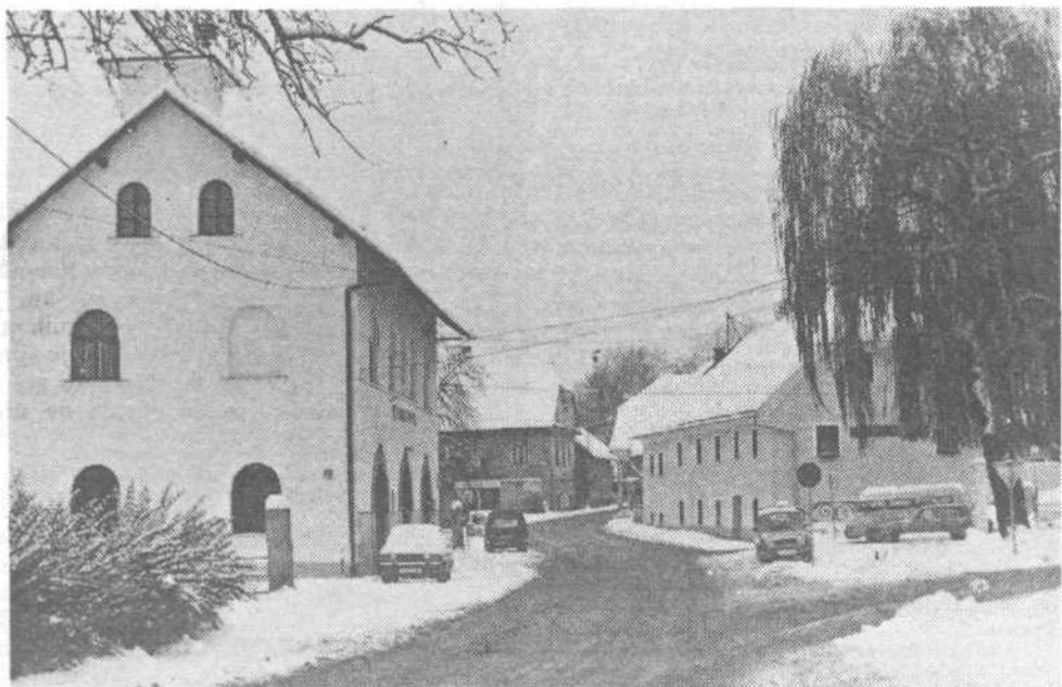
Viška panorama: novi metri asfalta in stanovanja

servisov ob Viški očitno ne bo nič, ker se je zataknilo pri denacionalizaciji zemljišč.