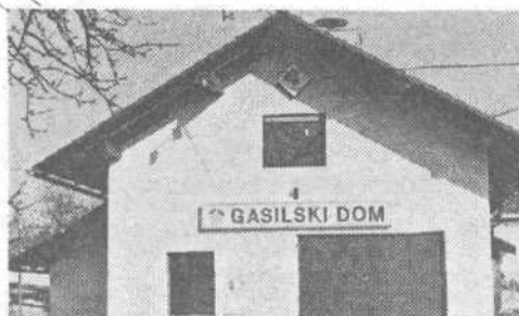
GD Preserje se najlepše zahvaljuje vsem, ki so pomagali pri obnovi gasilskega doma.

Dobava takoj! Odpri od 8. do 18. ure vsak dan!