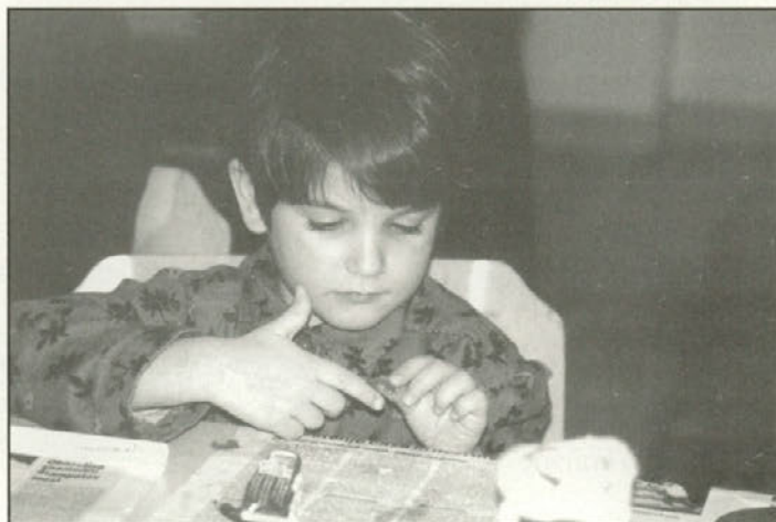
Malček med ustvarjalci