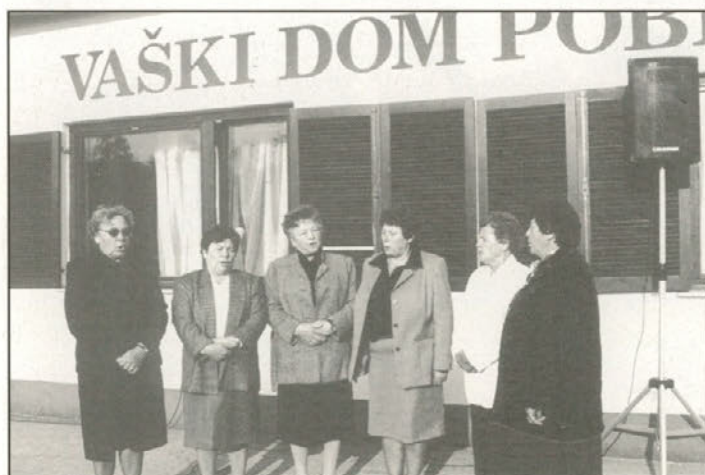
Nastopile so tudi ljudske pevke iz Pobrežja

V tem duhu si tudi v KS Pobrežje želimo primerno urediti kraj, v katerem živimo in delamo. Tako smo v iztekajočem se letu 2000 bogatejši za nekatere nove pridobitve na področju osnovne komunalne infrastrukture. S tem si želimo izboljšati naše poslanstvo na različnih področjih delovanja. Bogatejši smo za 730 m na novo asfaltiranih krajevnih cest in za 3200 m javne razsvetljave. V sodelovanju s Športnim društvom pa smo uredili tudi razsvetljavo športnega igrišča pri Vaškem domu v Pobrežju.