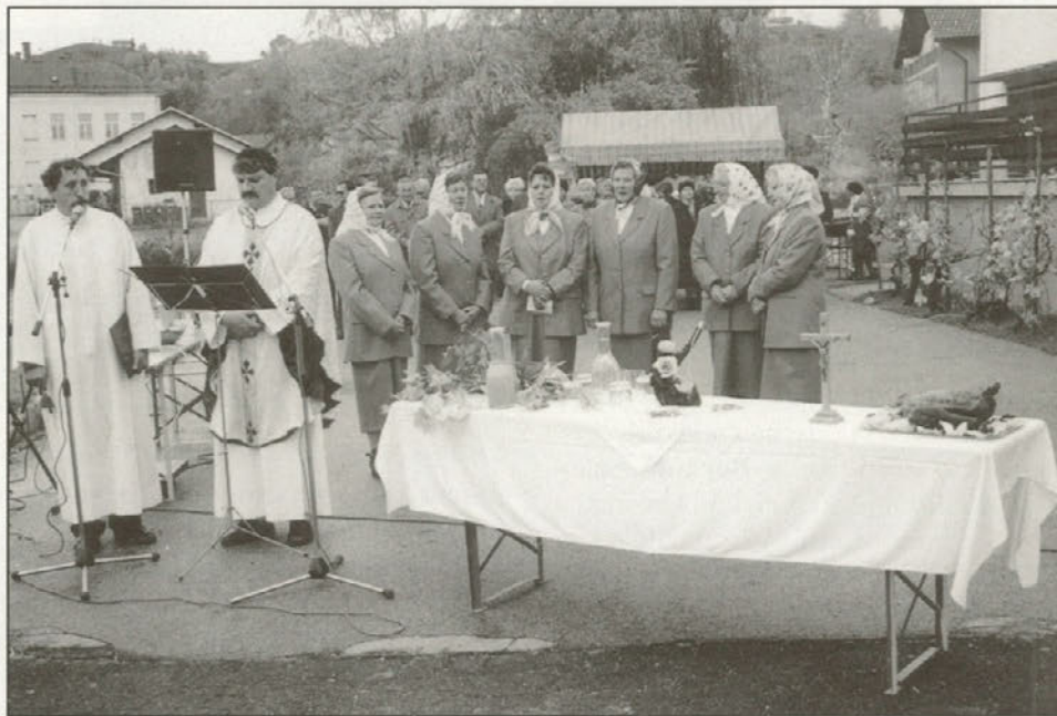
Predstavile so se tudi pevke iz Leskovca