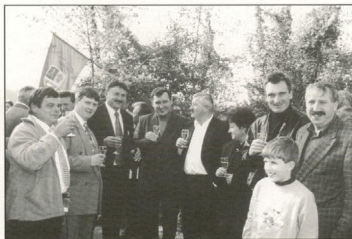
Ob koncu so se vsi skupaj poveselili ob kozarčku domačega

Vsega, kar se je nakopičilo v desetletjih razvoja in morečeh pritiska na okolje, seveda ni mogoče sanirati v kratkem času. Toda velikokrat rešujemo obrobne stvari, tisto, kar ljudi najbolj tišči, pa odlagamo.