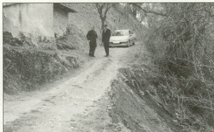
Težave s plazovi (eden od teh na območju KS Leskovec).

del sredstev nameniti tudi za vzdrževanje lokalnih cest. Zaradi takšnih tolmačenj je občina aktivneje posegla na ta področja investicij, kar se vidi tudi v predlogih letošnjega proračuna za leto 2001. Od že omenjenih lokalnih cest in javnih poti, ki niso asfaltirane, je potrebno poudariti, da je njihovo vzdrževanje izredno drago in pa kratkotrajno, saj se skoraj 70% le teh nahaja v hribovitem območju naše občine.