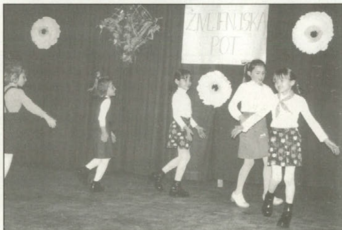
Utrinek s prijetnega kulturnega večera