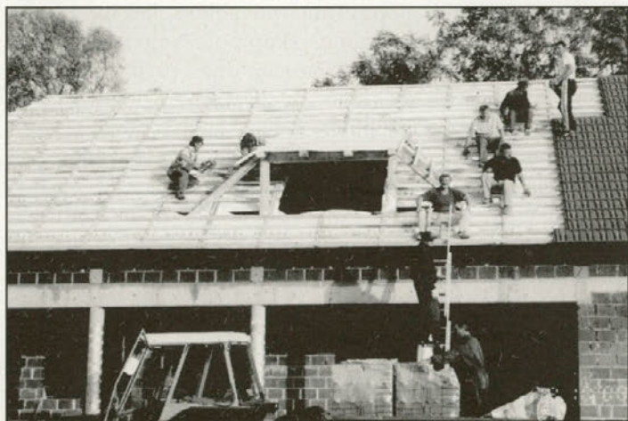
Tako je nastajala streha

Športno društvo Leskovec se je v našem glasilu že predstavilo in z velikim zadovoljstvom smo občane seznanili z gradnjo športnega objekta ob igrišču v Leskovcu. Objekt je medtem dobil novo, še bolj razpoznavno podobo, saj smo se člani, s pomočjo mnogih drugih krajanov trudili zgradbo pokriti in tako obvarovati pred prihajajočo zimo.