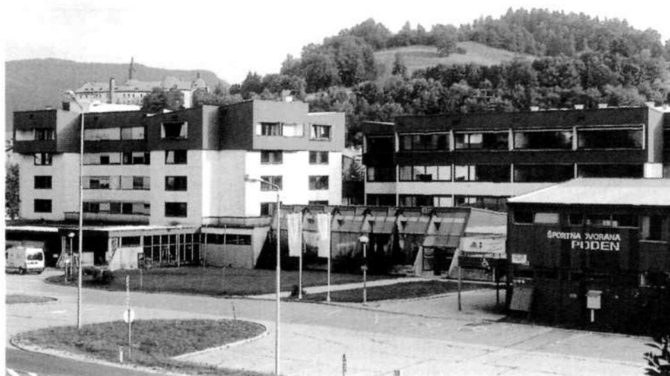
Šolski center, odprt leta 1981