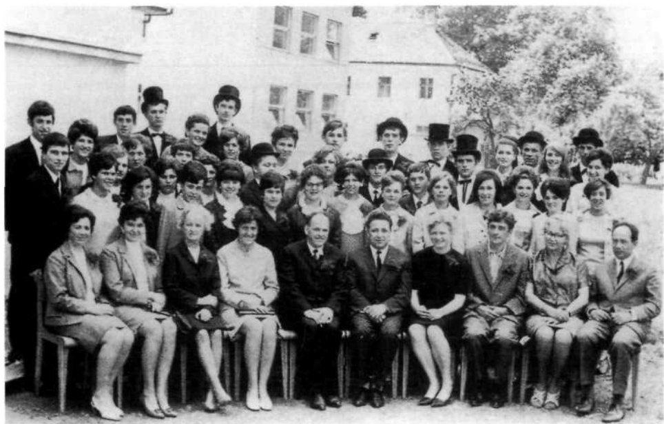
Maturantje in profesorski zbor v maju 1968