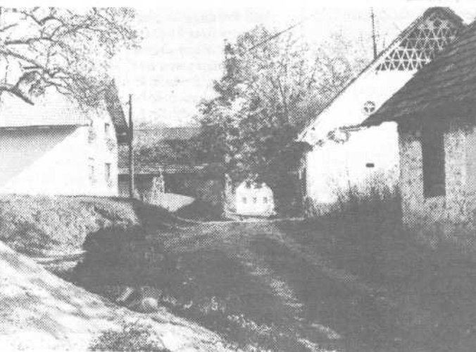
Dobravca nad Dobravco

Prijazna vasica nad južnim robom Ljubljanskega barja. Zjaj docela pozabljena, je bila nekoč bolj poznana, ker je tod minilo vodila edina pot z Iga, čez Pjavo Gorico, proti Ljubljani. Znano krajša je bila vodna pot, po Ilici in Ljubljani, ki so jo uporabljali, kadar so šli v mesto brez vprege. Zanimivo, da je spomin na ta potovanjski s čolni med ljudmi še živ, čeprav je od tega že polnih sto in petdeset let, pa še kakšen dan več.