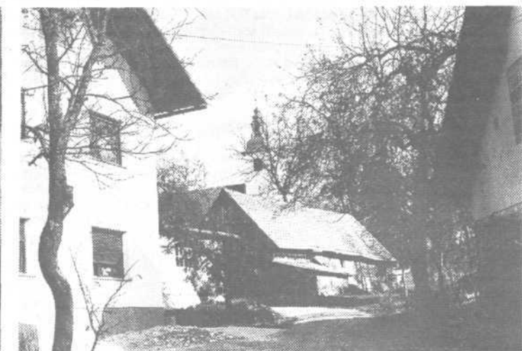
Dobravca nad Kremenico

Prijazna vasica nad južnim robom Ljubljanskega barja. Zjaj docela pozabljena, je bila nekoč bolj poznana, ker je tod minilo vodila edina pot z Iga, čez Pjavo Gorico, proti Ljubljani. Znano krajša je bila vodna pot, po Ilici in Ljubljani, ki so jo uporabljali, kadar so šli v mesto brez vprege. Zanimivo, da je spomin na ta potovanjski s čolni med ljudmi še živ, čeprav je od tega že polnih sto in petdeset let, pa še kakšen dan več.