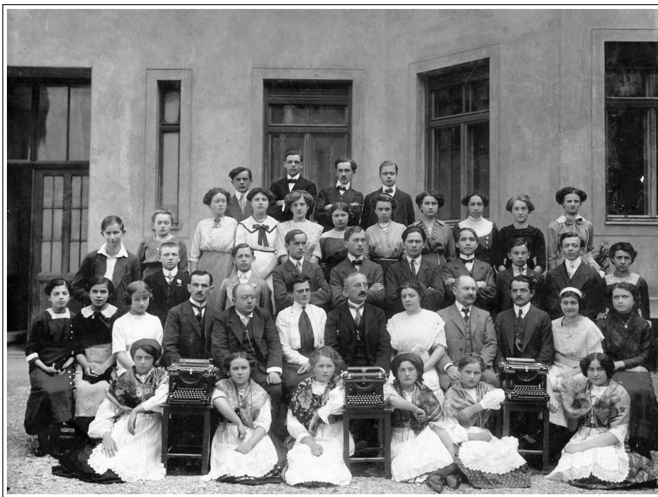
Učenci trgovske šole v Celju ok. 1910.