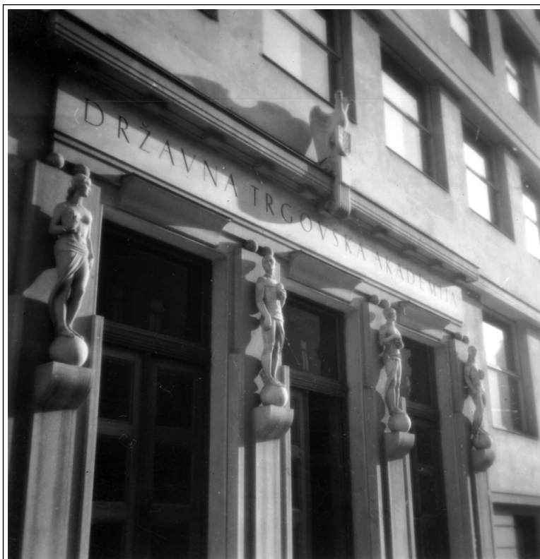
Portal Državne trgovske akademije v Ljubljani leta 1936.