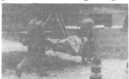
Ponesrečene je bilo treba spraviti na varno

»Prav gotovo je prav, da se preveri, koliko so vse te družbene organizacije in društva v skupnem odredu CZ pripravljene,« je ob koncu vaje na kratko