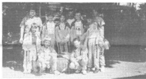
Mlada namiznoteniška ekipa ŠD Podpeč-Preserje

Zgraditi je bilo potrebno nov dimnik. Zgrajena je bila tudi tuš kabina. Potrebno pa bo pred mrazom še toplotno izolirati strop v celem objektu, za kar pa nam manjka sredstev. Radi bi tudi uredili garderobe za igralce. Z ogrevano dvorano smo prišli do prostora, ki je uporaben celo leto, izjemoma tudi za druge namene.