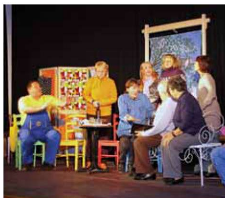
Z nastopa v Gračišču.

4. december Kulturni dom, Dolsko Gradiškovo srečanje pevskih zborov MePZ KPD Bazovica, zborovodkinja Maja Dobrila