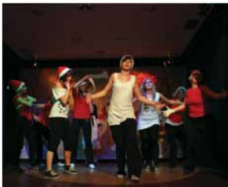
Plesna skupina KPD Bazovica nastopa pod vodstvom Hane Nusbaum.