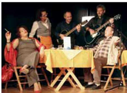
Kava in cigaret.

20. november Državni arhiv, Reka 8. salon hrvaške medklubske umetniške fotografije