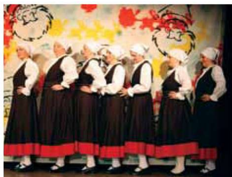
Folklorna skupina zaplesala v koreografiji Martine Mičetić.