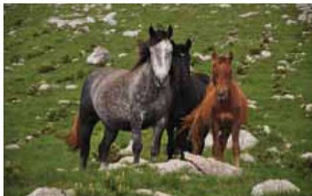
Darko Mohar je sodeloval s fotografijo z naslovom Konji.

V lepih prostorih Državnega arhiva je bil v organizaciji Foto kluba Color z Reke odprt 8. salon hrvaške medklubske umetniške fotografije. Na salon je prispelo več kot dvesto posnetkov članov sedmih hrvaških foto klubov. Med pri-