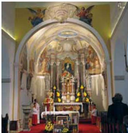
Župnijska cerkev Marije Vnebovzete v Slavini.