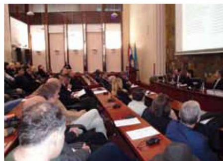
Zanimanje za preoblikovanje mesta napolnilo dvorano.