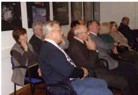
Na predavanju tudi gostje iz Ljubljane.