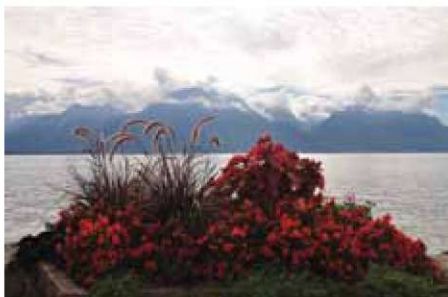
Lac Lenman.

19. november PD Snežnik, Ilirska Bistrica Občni zbor