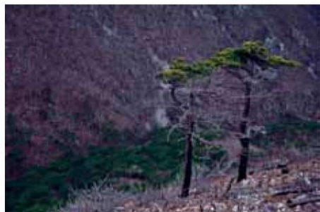
Na razstavi tudi fotografija Darka Moharja z naslovom Po požaru.