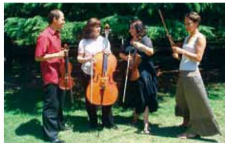
Ensemble Contemporanea 21.