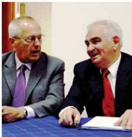
Novi in stari predsednik. Arhiv društva.