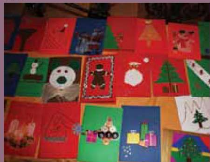
Mladi so izdelovali čestitke.

ko so krasili dvorano in izdelovali čestitke. Te so nato prodajali na prednovoletni prireditvi.