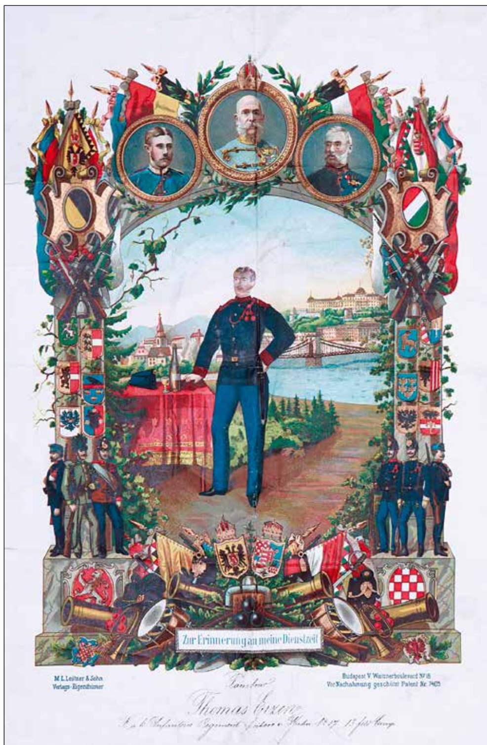
V spomin na služenje vojske.