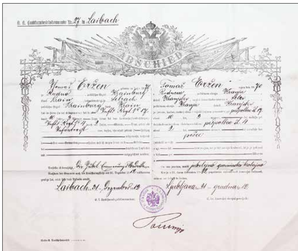
Odpustnica iz vojaške službe.

pri tem dovolj podjeten. Opravljal pa je tudi mnoge druge dejavnosti, ki niso bile plačljive.