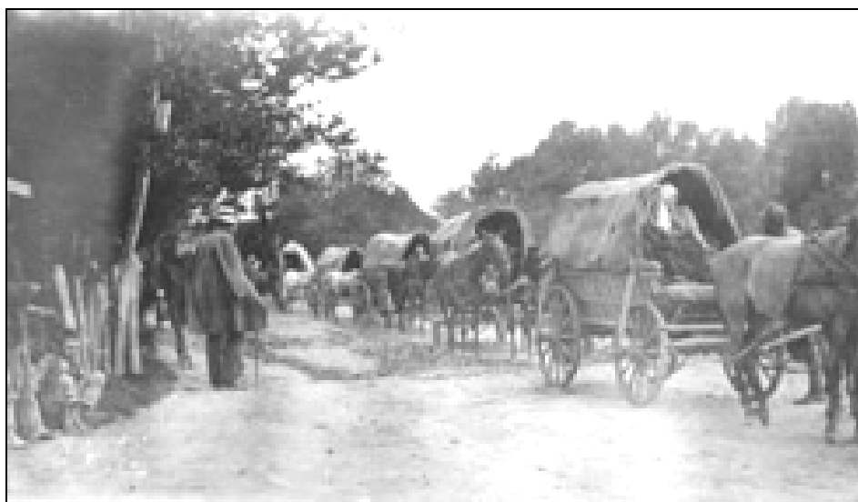
Begunci iz Galicije hitijo v neznanu

Na delo! Čez teden dni, 11. oktobra, je v Oznanilno knjigo zabeležil, da so za gališke begunce zbrali 13,70 K in dodal, da očitno premalo, "vendar se pri glavarstvu pritožujejo." 19