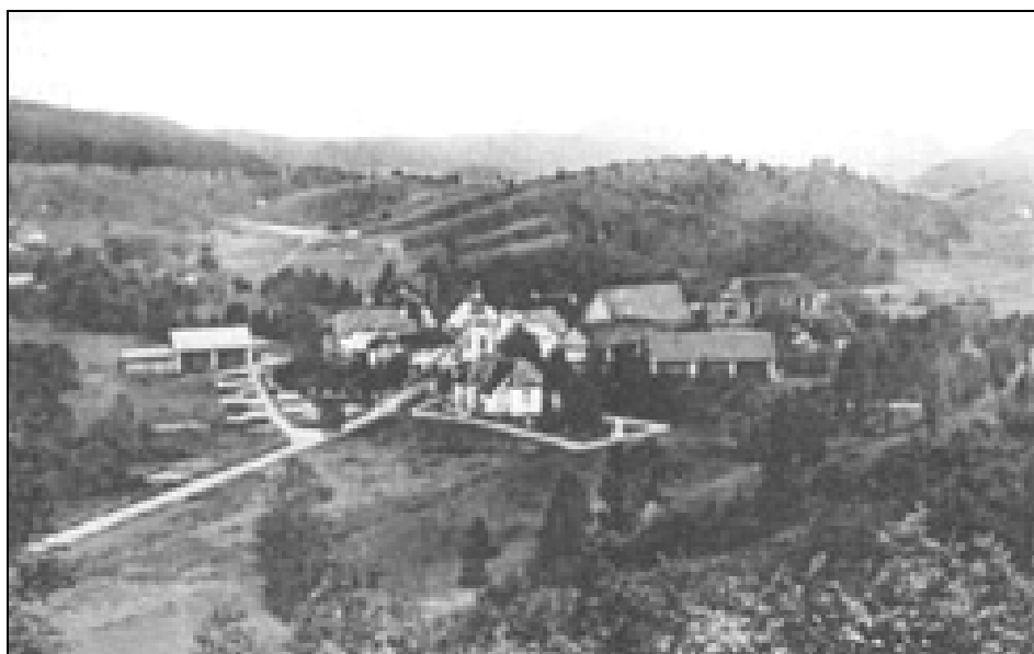
Godovič tik pred prvo svetovno vojno

med prvimi, za katere so poskrbele državne oblasti ob vojni nevarnosti. Podobno se je dogajalo z goriškimi železničarji ob vstopu Italije v vojno maja 1915. 32