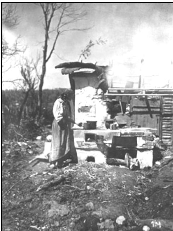
Posledice hudih bojev v Galiciji. Domačinka si pripravlja skromen obrok na štedilniku, ki je ostal v porušeni hiši

1914/15 objavil niz člankov, ki naj bi bralcem približali Rusine, Galicijo, Lvov in unijatsko vero. Ob božiču, ki so ga Rusini praznovali po julijanskem koledarju, je bil tiskan rusinski božični letak in poslan v vse župnije, kjer so bivali begunci. Šlo je za skrajšano izdajo nabožnega časopisa "Misijonar", ki so ga pred vojno v kraju Žolkva pri Lvovu izdajali menihi bazilijanci. Letak so tiskali v Zagrebu, kjer so menihi našličasno zatočišče. 27