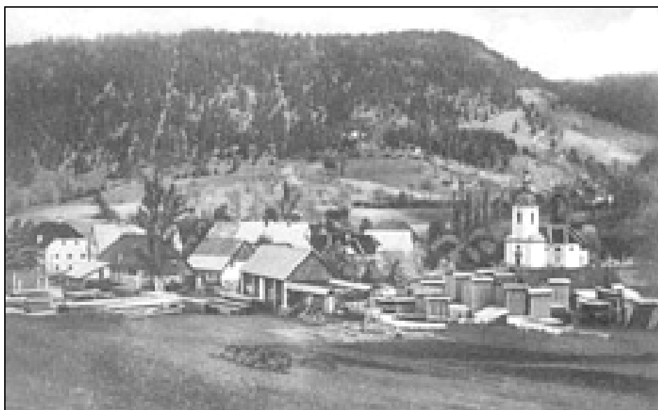
Godovič po prvi svetovni vojni (razglednica iz privatne zbirke)

Seznam beguncev v Godoviču leta 1915: 36