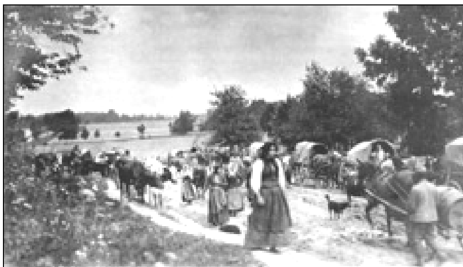
Begunci iz Galicije hitijo v neznano

državne stroške. 8 Tudi kasnejša sporočila in obvestila ob začetku spopadov prinašajo novice o dobri preskrbi in počutju beguncev ter zbuja upanje na skorajšnjo vrnitev. Oblasti so apelirale na civilno prebivalstvo, naj bo odprto in sočutno do rusinskih beguncev, ker "niso vsiljivci, niso postopači." 9