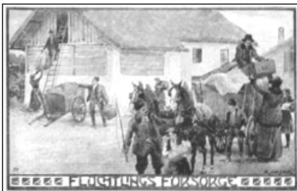
Reprodukcija razglednice, izdane v korist beguncev iz Galicije