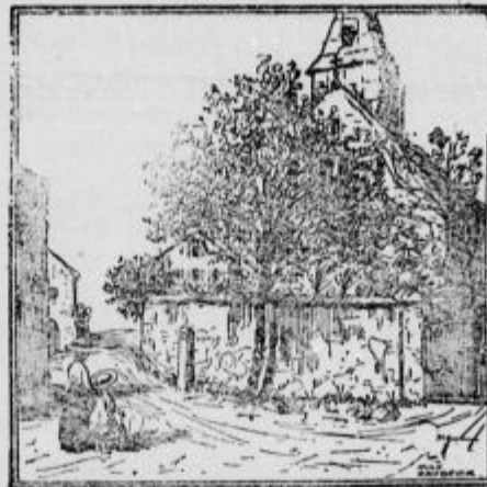
Kje je oče?

Olje za stroje Olje za cilindre Zgoščena mast Maža za vozove Karbolinej M. Elfer