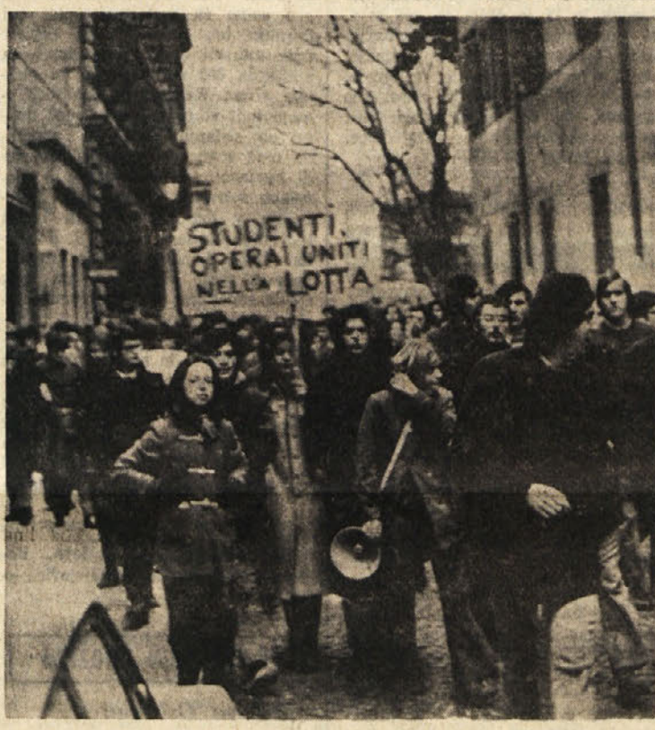
Srednješolski dijaki so s svojim sprevedom po mestnih ulicah izpričali solidarnost s stavkajočimi kovinarji.