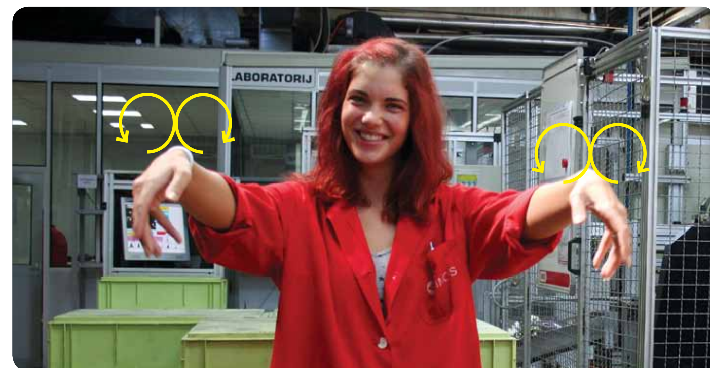
Slika 2: Primer izvajanja aktivnih odmorov na delovnem mestu

5 V obdobju enega leta od zaključka izobraževanja so v treh delovnih organizacijah pričeli z izvajanjem aktivnih odmorov med delovnim časom.