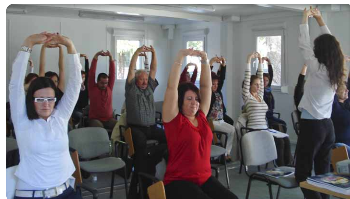
Slika 3: Utrinek iz izobraževanja

6 V vseh sodelujočih podjetjih so po izobraževanju izvedli vsaj eno aktivnost promocije zdravja na delovnem mestu (predstavitev projekta oz. izobraževanja, ki so se ga udeležili, predavanje na temo promocije zdravja, vzpostavitev info kotička »za zdravje« v delovni organizaciji, članki o promociji zdravja na delovnem mestu v internih časopisih oz. intranetu ipd.).