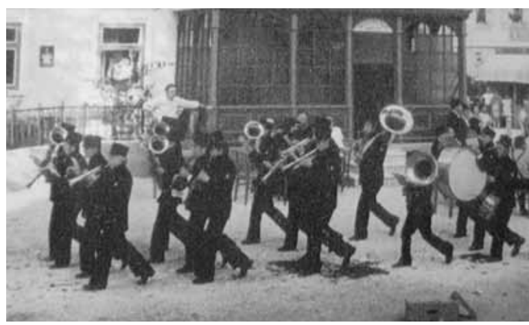
Snemanje televizijske nadaljevanke o Ipvcih, 1975