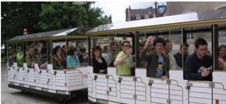
Ogledovanje znamenitosti s turističnim vlakcem, Francija, 2006