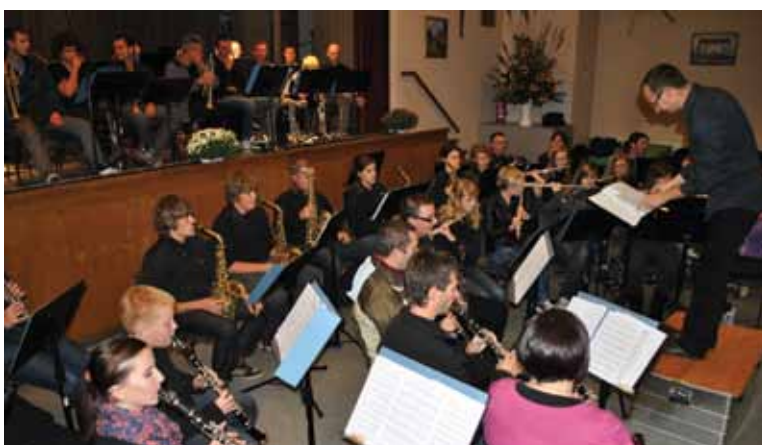
Vaja za večerni sobotni koncert, Berlin, 2011