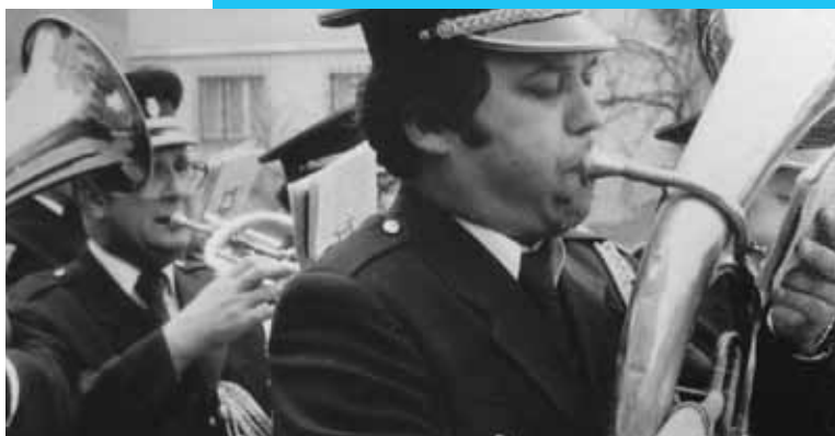
Nastop z orkestrom, slikano v obdobju med letoma 1976 in 1982