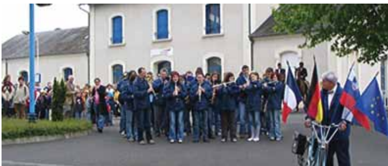
Igranje na povorki otrok iz vrtcev in šol, Francija, 2006