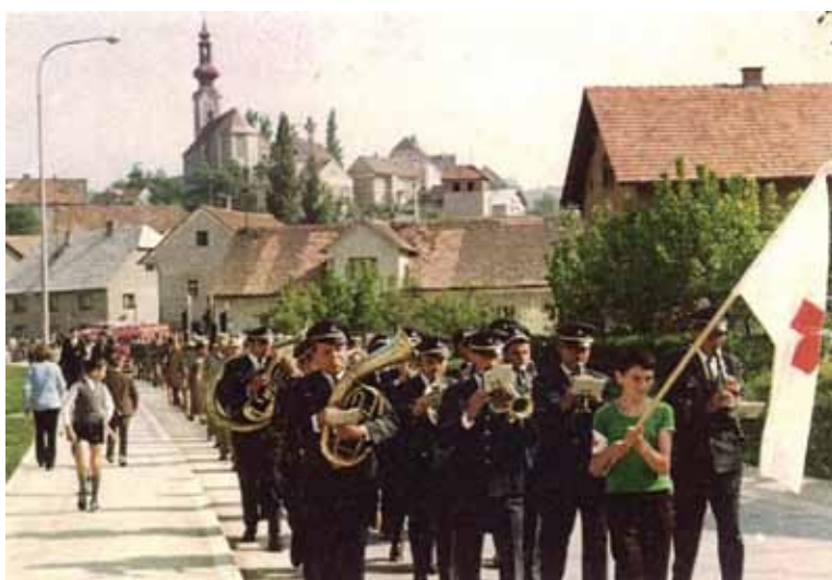
Nastop na proslavi Rdečega križa v Šentjurju leta 1971