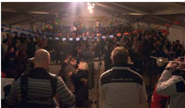
Silvestrovanje na Mestnem trgu v Šentjurju