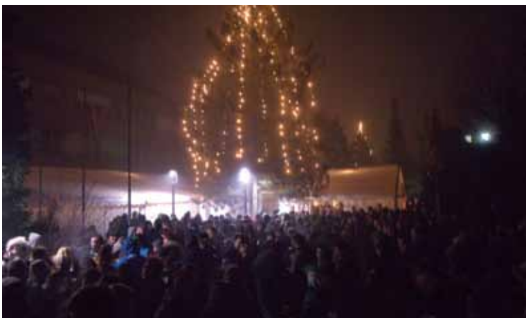
Silvestrovanje na Mestnem trgu v Šentjurju