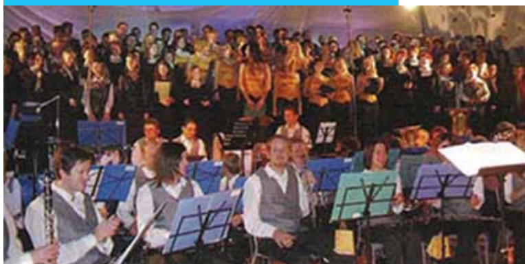
Koncert ob 70-letnici delovanja Pihalnega orkestra Šentjur, dvorana Hruševac, 2004