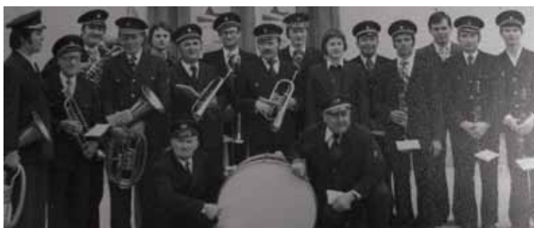
Nastop pred Kulturnim domom Šentjur, 1981