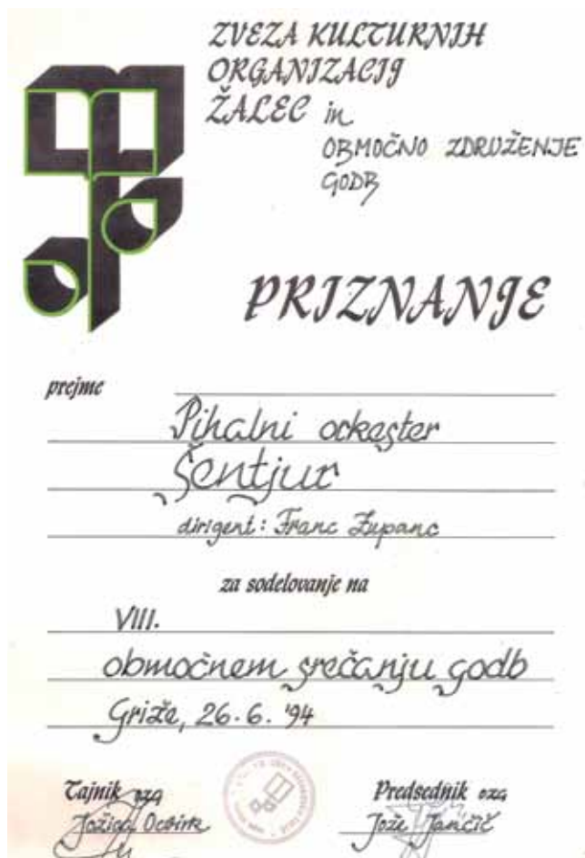
Priznanje za udeležbo na Območnem srečanju godb, Grize, 1994