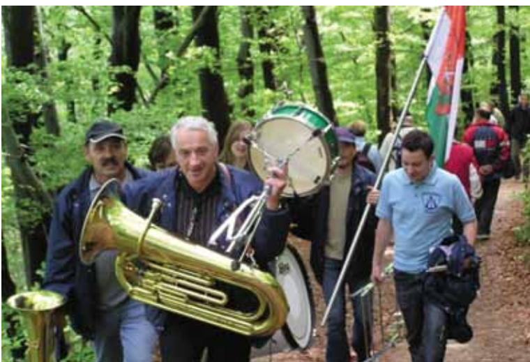
Pihalni orkester na poti na Resevno, kjer je igral na prvomajskem srečanju, 2006