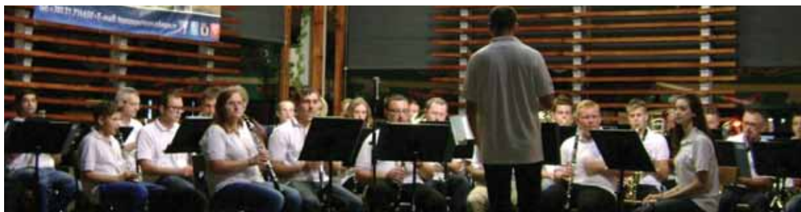
Koncert Pihalnega orkestra v Požegi