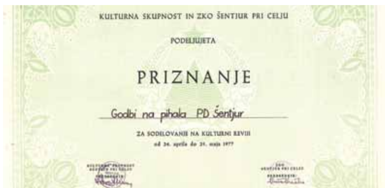
Priznanje za sodelovanje na Kulturni reviji, 1977