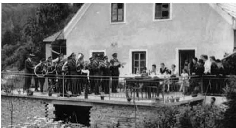
Nastop v Šibeniku leta 1969