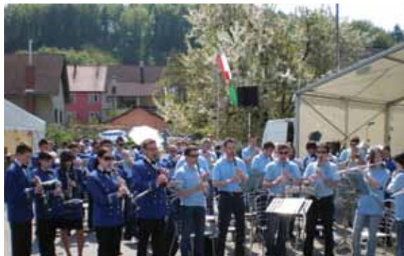
13. srečanje pihalnih orkestrrov, Godba slovenskih železnic in Pihalni orkester Šentjur