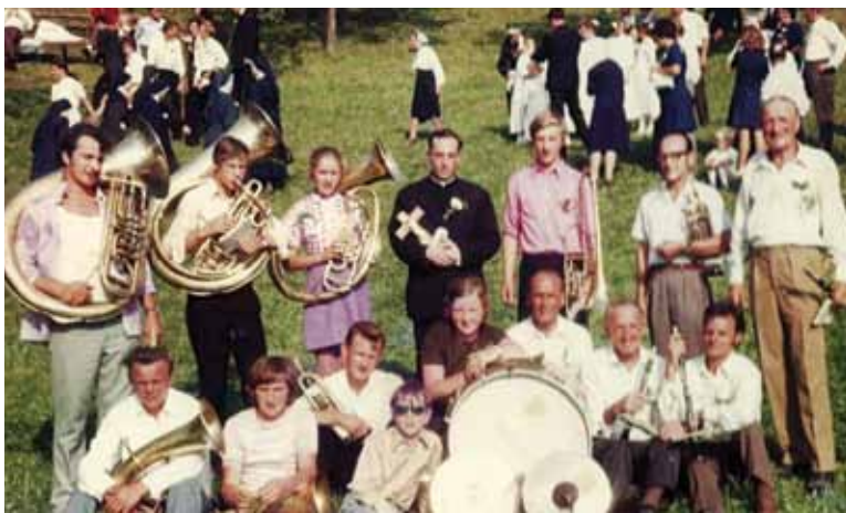
Šentjurski godbeniki so igrali na novi maši v Šentrupertu, slikano leta 1972