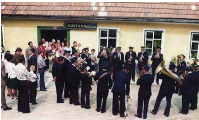
Nastop v Šentrupertu leta 1971