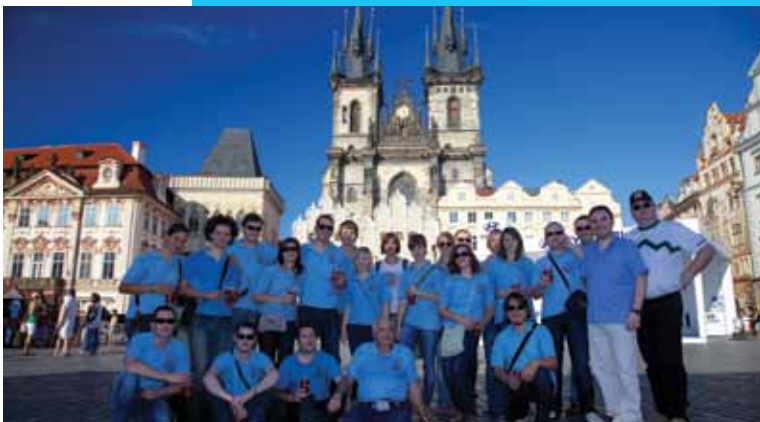
Gostovanje v Pragi