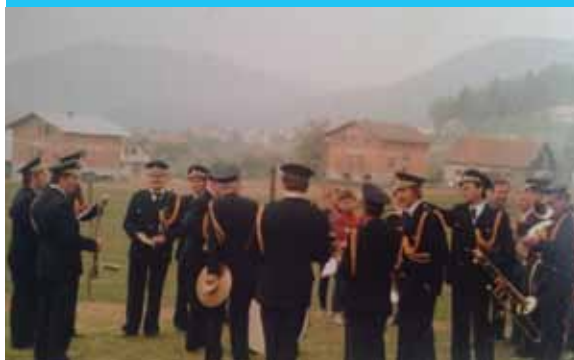
Budnica, Nova vas, 1981

Za člane orkestra pa je ta dan vse prej kot praznik dela, kajti njihovo igranje in potovanje iz ene krajevne skupnosti v drugo se pričinja v zgodnjih jutranjih urah in konča približno v času kosila. Nekaj let so z budnico pričenjali okoli šeste ure zjutraj, ta ura se je počasi pomikala nazaj, tako da zadnji dve leti pričnejo z zbujanjem Šentjurčanov že ob tretji uri zjutraj. Pričnejo v Šentjurju pri Centru kulture Gustav, nato pa nadaljujejo na Kalobje, Planino pri Sevnici, v Šentvid pri Planini, na Prevorje, v Dobrino, Gorico pri Slivnici, Novo vas, Hruševac, Šentjur, Hotunje, na Ponikvo in Grobelno. Nato se vrnejo k Domu starejših občanov v Šentjur in zaključijo pri piceriji Osmica okrog 13.00 ure.