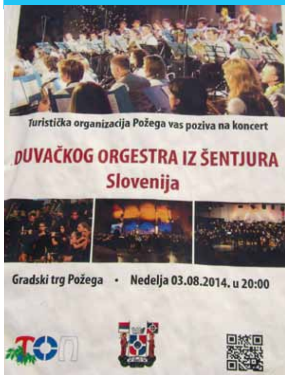
Plakat - Požega, Srbija