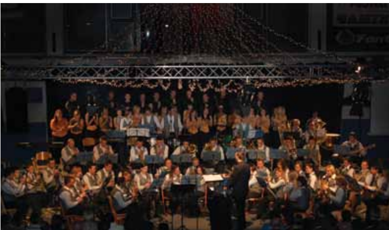
Božično-novoletni koncert 2007