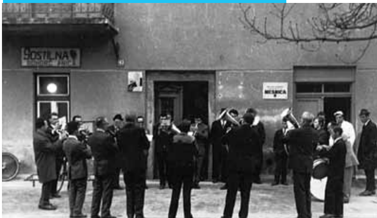
Nastop pred znanim gostiščem Bohorč v Šentjurju, slikano leta 1972