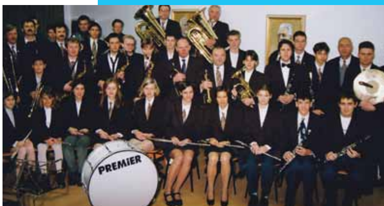
Orkester na vajah pred koncertom, slikano v dvorani Glasbene šole Šentjur, kjer je orkester takrat imel tudi godbene prostore.