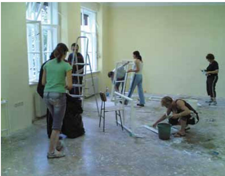
Čiščenje in priprava prostorov v Centru kulture Gustav, Šentjur, 2007