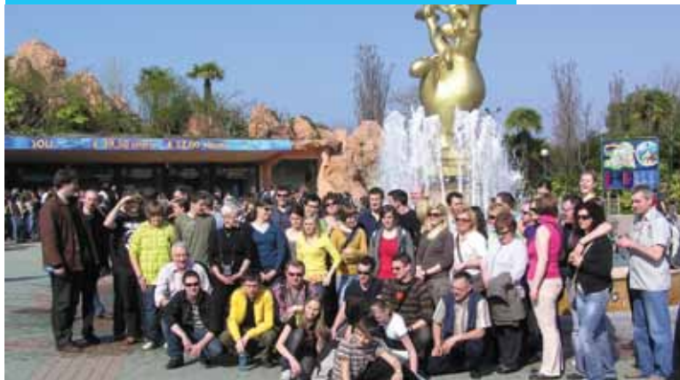
Izlet v Gardaland