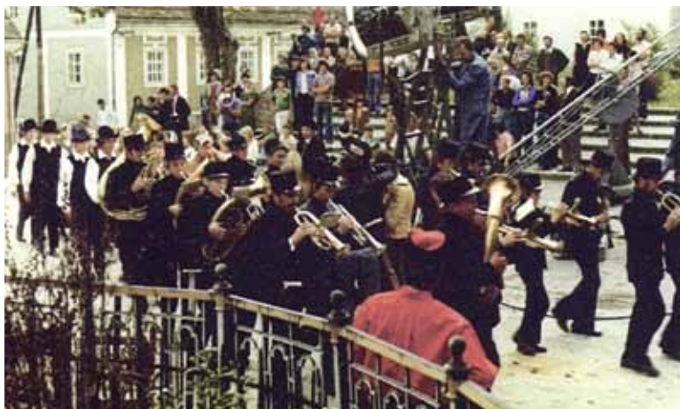
Slika s snemanja televizijske nadaljevanke o Ipavcih. Zgornji trg, 1975