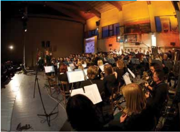
Koncert, junij 2010