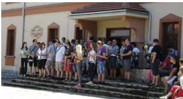
Dopoldanski promenadni koncert pred Muzejem 'trubačev' v Guči