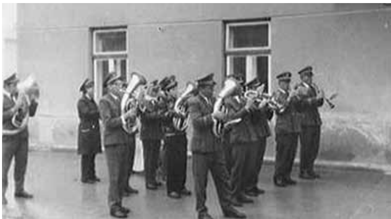
Nastop pred znanim gostiščem Bohorč v Šentjurju, slikano leta 1972