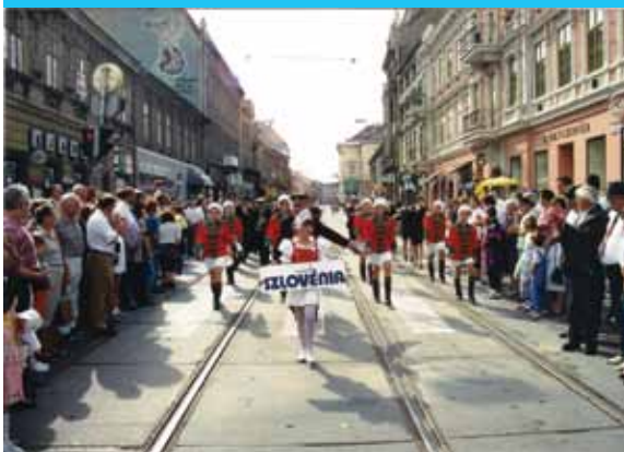
Nastop na festivalu na Madžarskem, 1996