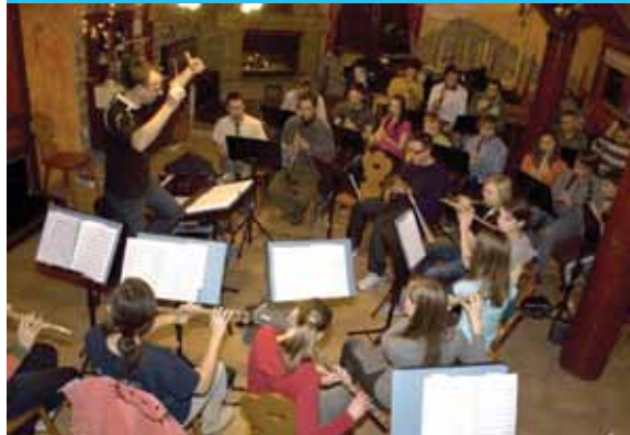
Intenzivne vaje na Kopah, 2010

Za vse člane orkestra pa so tako z vidika igranja kot z vidika druženja zelo pomembne tudi intenzivne vaje, ki se jih udeležijo konec meseca novembra ali v začetku decembra, da se dodobra pripravijo na kvalitetno izvedbo Božično-novoletnega koncerta.