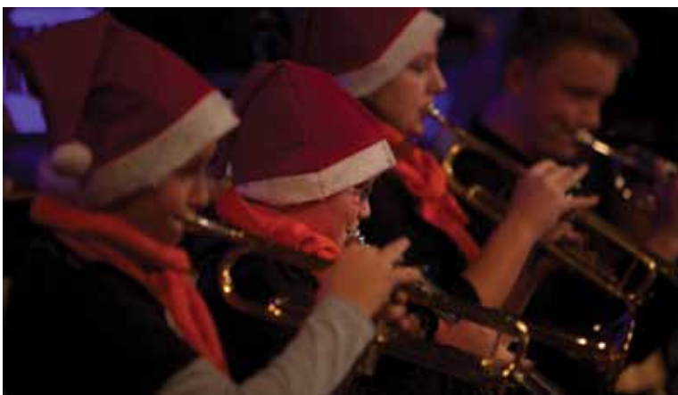
Mali pihalni orkester, Božično-novoletni koncert 2013