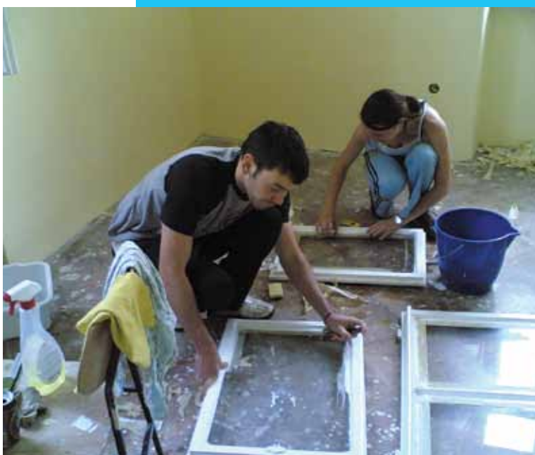
Čiščenje in priprava prostorov v Centru kulture Gustav, Šentjur, 2007