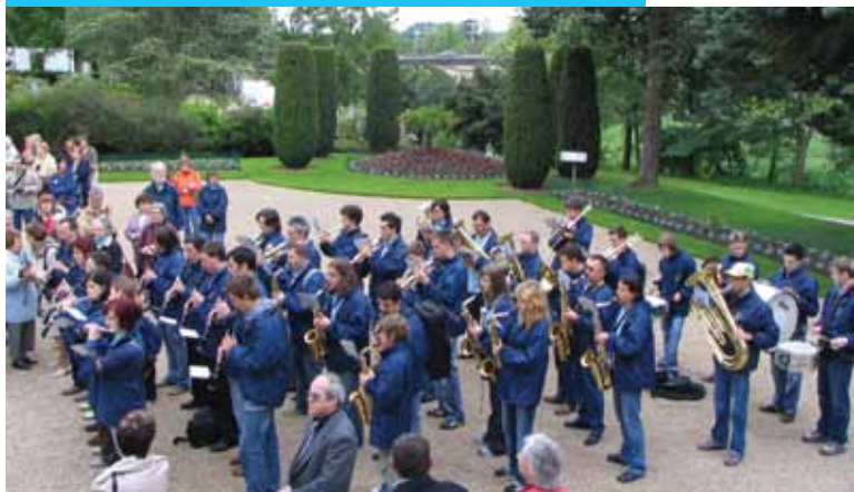
Igranje ob podpisu pogodbe o sodelovanju v Franciji leta 2006