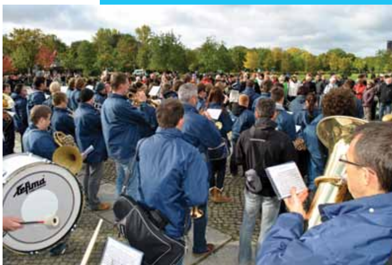
Pred parlamentom se je hitro zbrala množica poslušalcev