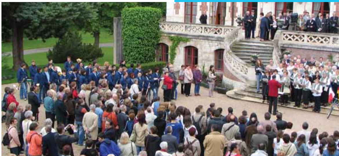
Nastop ob podpisu pogodbe o sodelovanju med Francijo, Nemčijo in Slovenijo; Francija, 2006