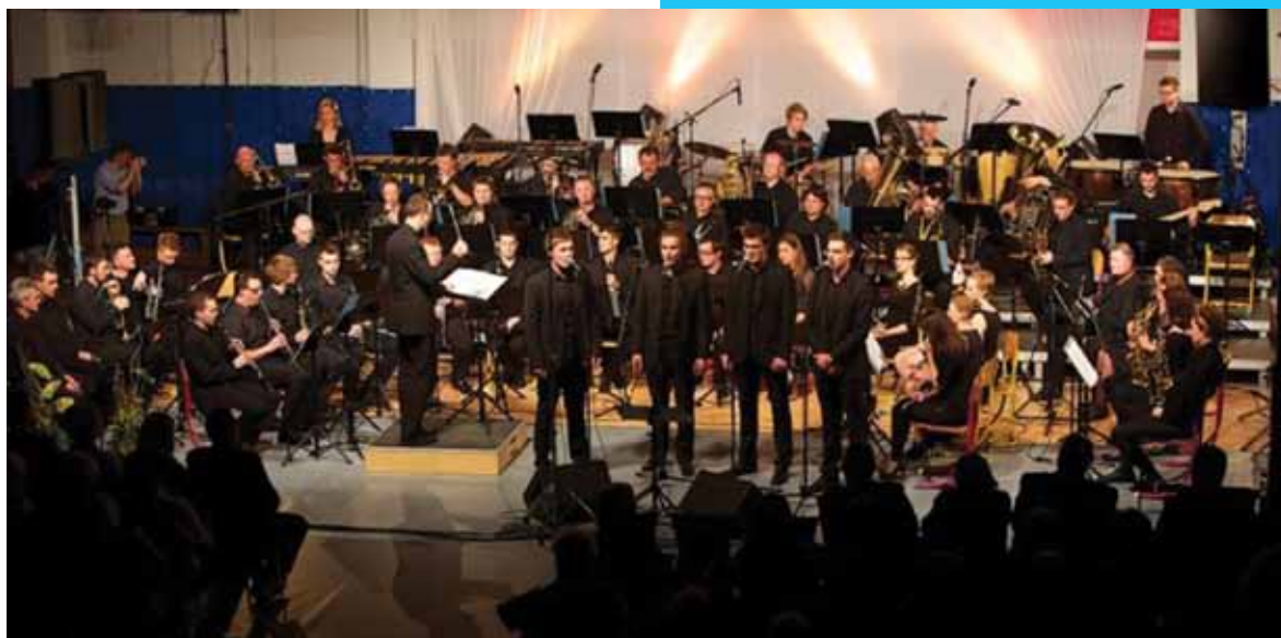
Koncert junija 2013 s kvartetom Cabaret