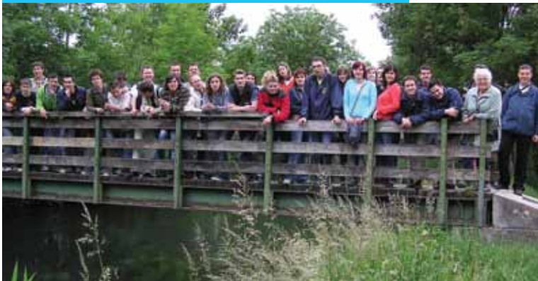
Ogled botaničnega vrta, Francija, 2006