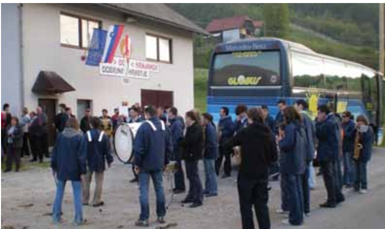
Budnica v Dobrini, 2008