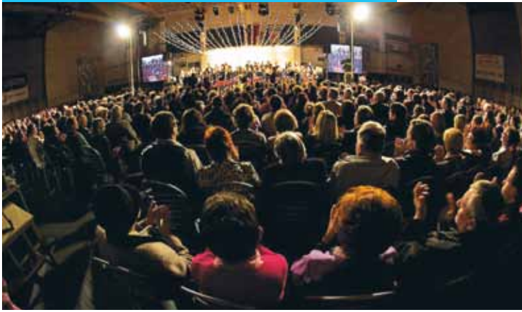
Pogled na polno dvorano Hruševce, 2009