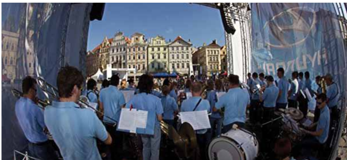
Nastop na festivalu ob počastitvi svetovnega prvenstva v nogometu, Prague foot summer, Praga, 2010