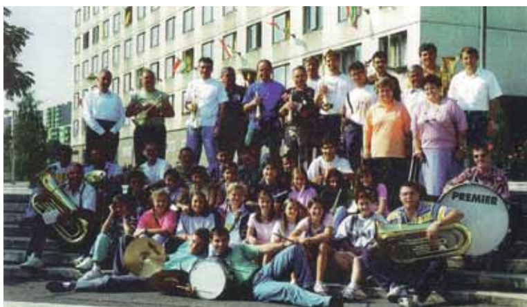
Skupinska fotografija, Madžarska 1996