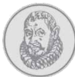
Srebrna Gallusova značka za več kot 10 let udejstvovanja