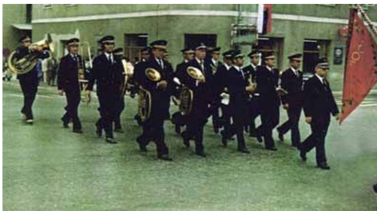
Nastop na povorki ob 100. letnici Gasilskega društva Šentjur, Šentjur, 1974