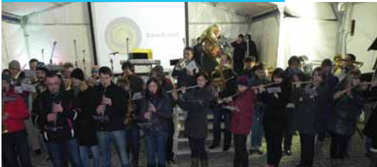
Silvestrovanje na Mestnem trgu v Šentjurju