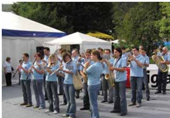
Jožefov Sejem, Kozje, 2005