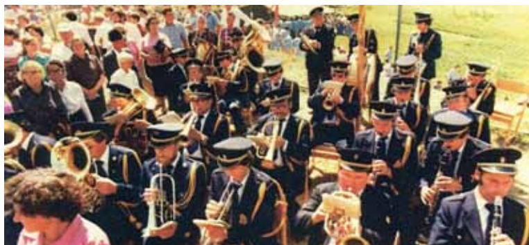
Nastop ob občinskem prazniku na Planini pri Sevnici. Slikano v osemdesetih letih 20. stoletja.