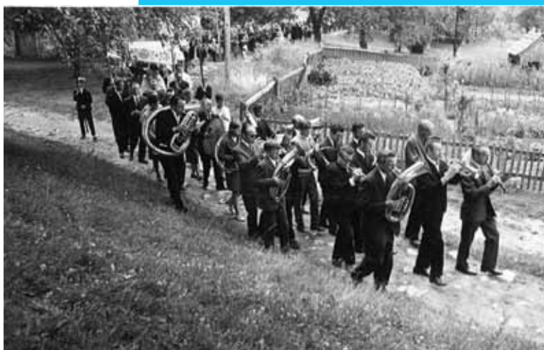
Nastop na procesiji na Kalobju, slikano okoli leta 1971