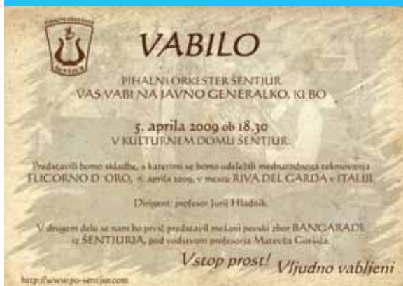
Vabilo na javno generalko pred tekmovanjem v Italiji, 2006