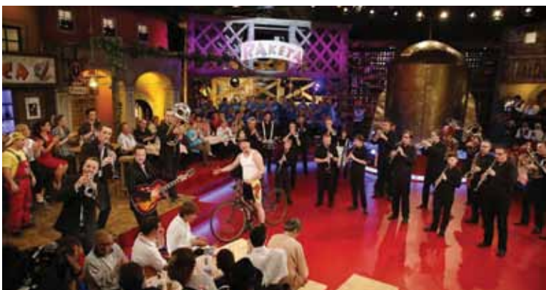
Gostje oddaje RAKETA, tekmovanje za napitnico in poskočnico skupaj z ansamblom Petka