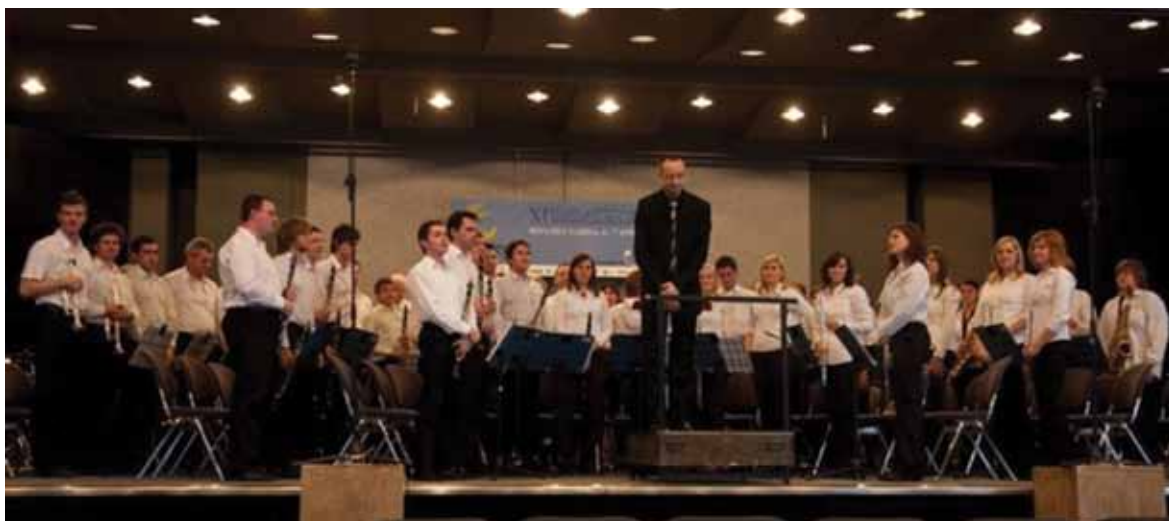
Mednarodno tekmovanje pihalnih orkestrrov Riva del Garda, Italija