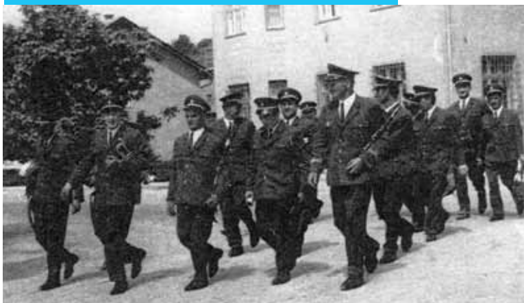
Prvi javni nastop Šentjurske godbe na občinskem prazniku, 18. avgusta 1968, slikano v Šentjurju.