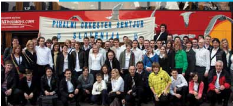
Tekmovanje in izlet v Gardaland, 2009