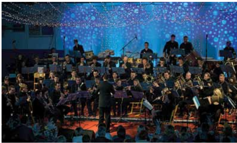
Božično-novoletni koncert v Hruševcu, 2009

Na svojih koncertih je orkester gostil različne znane glasbene skupine in soliste, ki so še dodatno popestrili koncertni program. Leta 2006 je orkester obiskal pobrateno občino v Franciji, kjer je predstavljal Občino Šentjur.