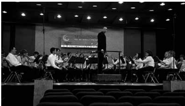
Pihalni orkester na tekmovalnem odru v Italiji leta 2009