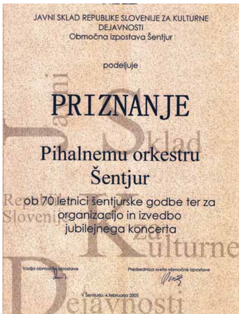
Priznanje ob 70-letnici orkestra, podeljeno leta 2005 za leto 2004