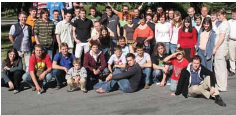
Skupinska fotografija, Francija, 2006