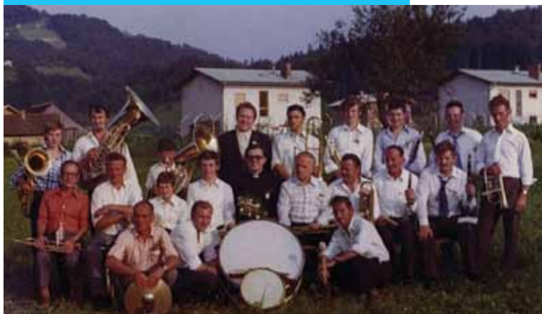
Nastop na novi maši v Hruševcu, slikano leta 1974