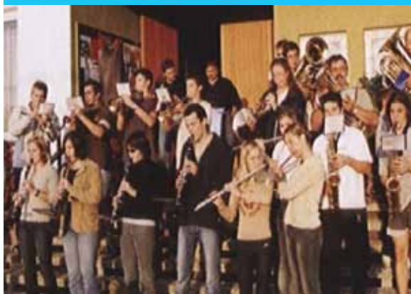
Nastop pred kulturno dvorano v Šentprimožu, 2004

V letu 2004 se je orkester vrnil v Šentprimož, tokrat okrepljen z Zborom skladateljev Ipavcev. Srečanje je potekalo zelo sproščeno, godbeniki so tokrat igrali le koračnice iz notnih knjižic, v žaru druženja pa je bila odigrana tudi nogometna tekma. Po končanem druženju so se godbeniki istega dne vrnil domov.