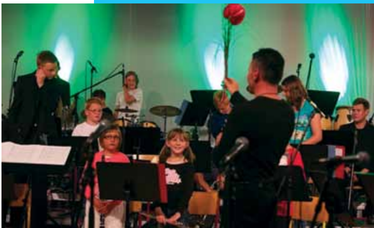
Mali pihalni orkester na koncertu v Hruševcu, junij 2013

Z letom 2011 je orkester pričel z glasbenim izobraževanjem, s katerim želi neposredno poskrbeti za svoj podmladek in njihovo glasbeno znanje. Izoblikoval se je tudi Mali pihalni orkester, kjer učenci prvič vzpostavijo stik z igranjem v orkestru in spoznavajo osnove delovanja orkestra. Mali orkester nastopa na koncertih Pihalnega orkestra Šentjur, letos pa so nastopili tudi v oddaji Moja Slovenija.