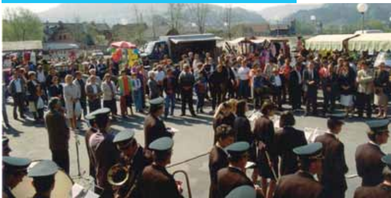
Nastop pihalnega orkestra na Jurjevem sejmu v Šentjurju, 1997