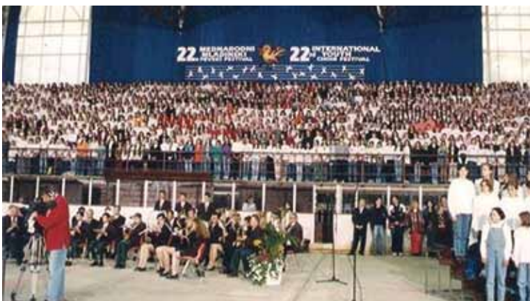
Nastop Pihalnega orkestra Šentjur na 22. Mednarodnem mladinskem pevskem festivalu v Celju, 1. 6. 1997. Na festivalu je nastopilo preko 60 zborov iz Slovenije in tujine.