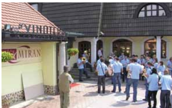
Zaključek prvomajske budnice pri nekdanjemu gostišču Miran, 2009