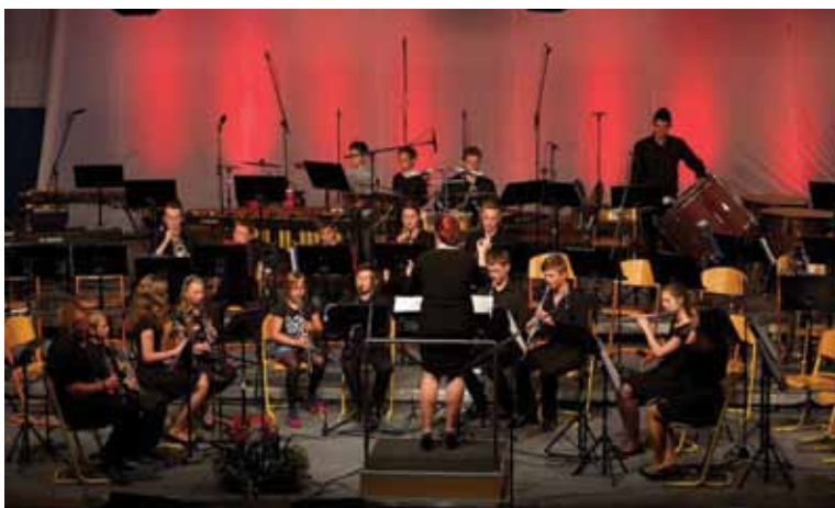
Nastop Malega pihalnega orkestra Šentjur v Hruševcu, 24. 6. 2014