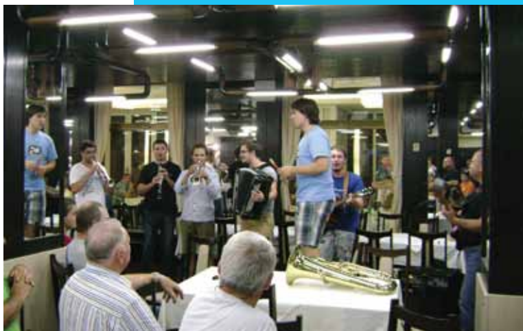
Zabavni večer v hotelu Požega z ansamblom Sekstakord