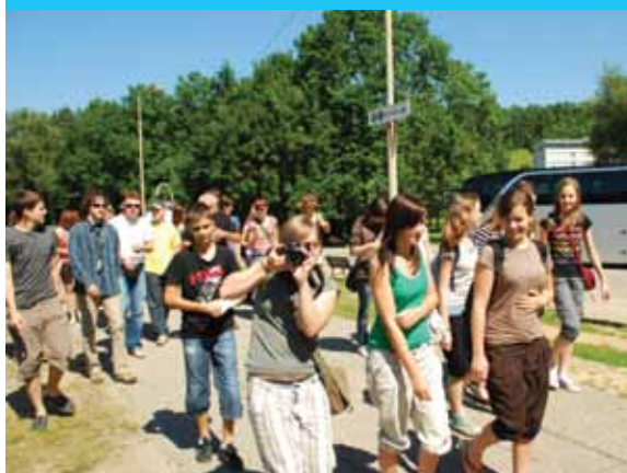
Potepanje po Pragi