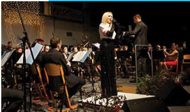
Božično novoletni koncert 2011 z gostjo Nušo Derenda