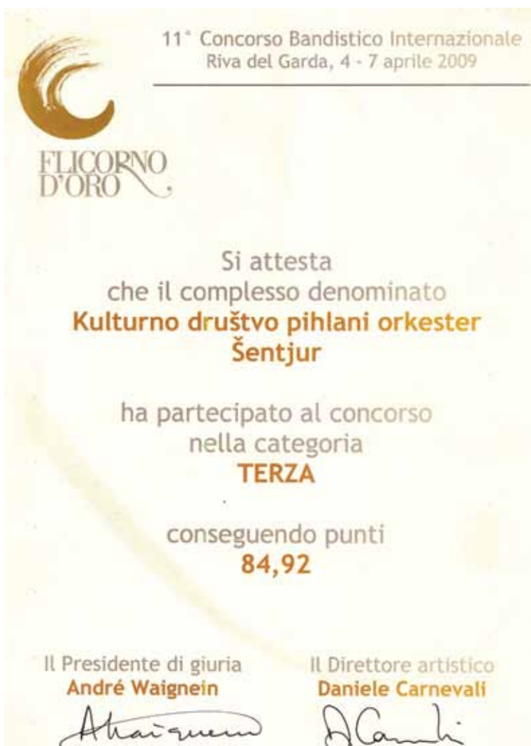
Priznanje z Mednarodnega tekmovanja pihalnih orkestrrov, Riva del Garda, Italija, 2009