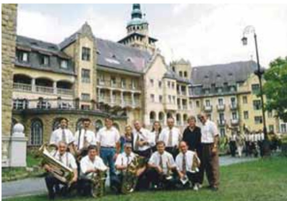
Spominska fotografija, Madžarska, 1996