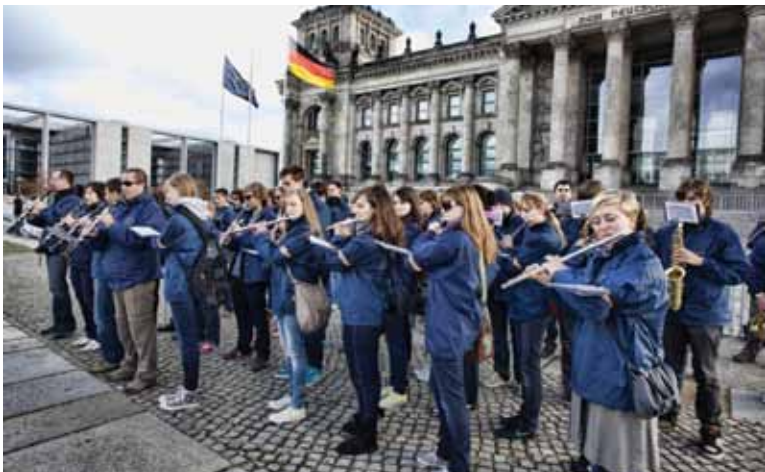
Nastop orkestra pred nemškim parlamentom