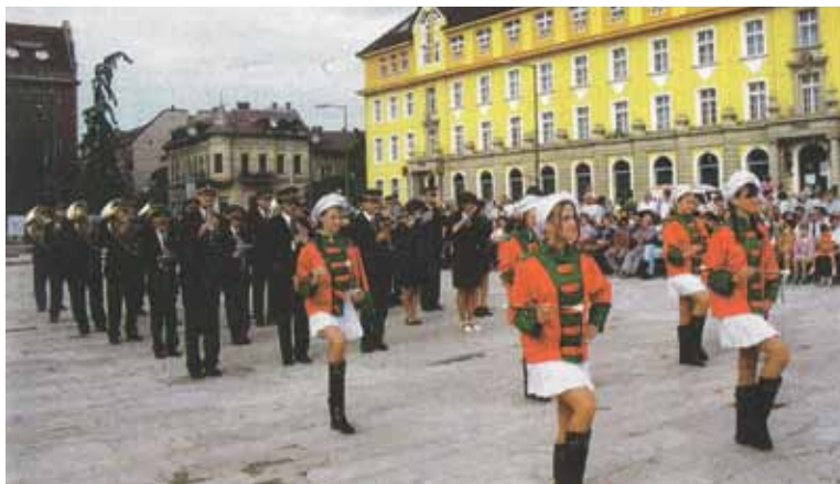
Gostovanje na Madžarskem, 1996