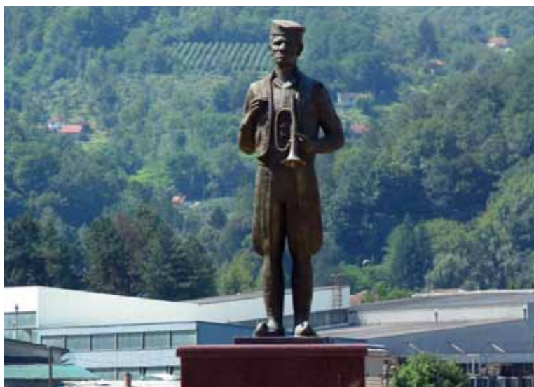
Kip 'trubača' pred vstopom v mesto Guča