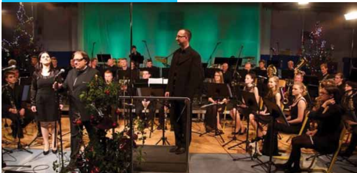
Božično-novoletni koncert 2013 z gostoma Majo Šturm in Otom Pestnerjem