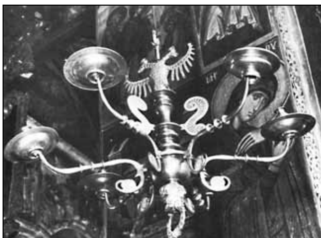
Sl. 3: Dečani, svećnjak iz manastira (prema Šakota, 1984, sl. 5).