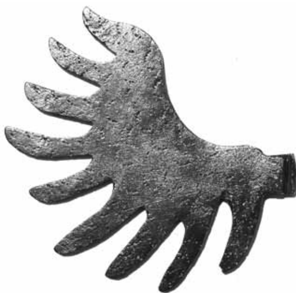
Sl. 4: Beogradska tvrđava – Zapadno podgrađe, deo renesansnog svećnjaka.

Sudeći prema ukupnom izgledu, svećnjak iz Dečana najbliži je nalazima iz Gnalića, pa se može pretpostaviti da je nastao u isto vreme, tokom druge polovine 16. veka. Ipak, taj nalaz, kao i neki drugi slični, poput svećnjaka iz Libeka ili Bremena, raskošniji su od dečanskog, utoliko što imaju više krakova u dva ili tri reda (Jarmuth, 1967, figs. 143, 151).