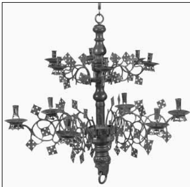
Sl. 2: Sopoćani, svećnjak iz manastira nakon rekonstrukcije.

Sudeći prema broju žljebova, na svećnjaku se izvorno nalazilo po šest grana u dva reda. Preostali delovi svećnjaka nisu otkriveni, tako da nije moguće sasvim pouzdano utvrditi njegov originalni izgled. Ukupnim izgledom svećnjaku iz Sopoćana slični su primerci koji su na osnovu stilskih karakteristika okvirno datovani u razdoblje 15. i prve polovine 16. veka, npr. iz crkve Sv. Jakova u Ahenu, iz Memlingmuseuma u Brižu (broj B4299), kao i jedan iz Rijksmuseuma u Amsterdamu (broj BK-NM-10798), koji se najverovatnije nalazio u crkvi Sv. Jovana u Hertogenbošu (Sint Janskerk te s'Hertogenbosch) (Jarmuth, 1967, Abb. 92, 157–159). Na svim navedenim, a i ostalim svećnjacima ovog tipa, nad telom u vidu profilisanog stubića gotovo po pravilu nalazila se figura Bogorodice, na čiju krunu je pričvršćivana alka sa lancem, pomoću kojeg se svećnjak kačio o strop (Jarmuth, 1967, Abb. 87, 88, 91, 92, 156–159). Ovo otvorenim ostavlja mogućnost da je i sopoćanski primerak mogao izvorno slično izgledati. Utisak je da je