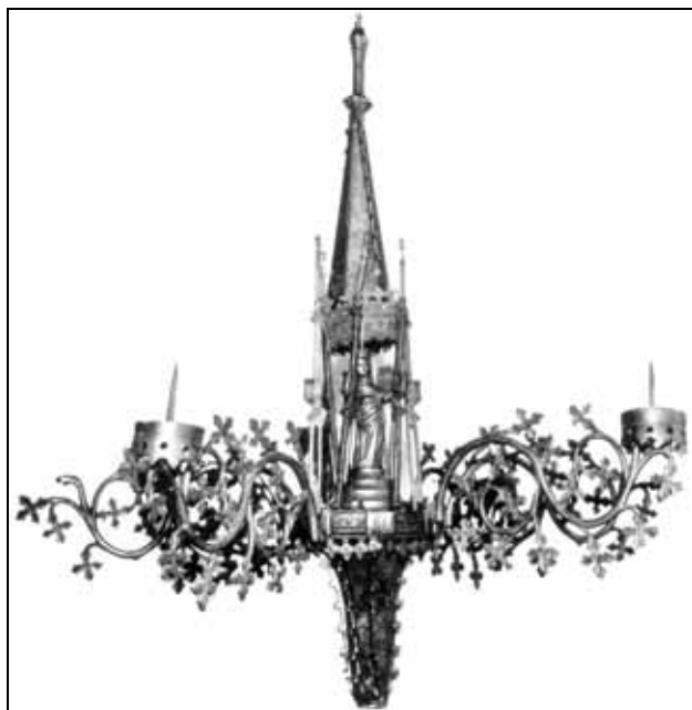
Sl. 1: Dečani, svećnjak iz manastira (prema Timotijević, 1986, sl. 1).

Do danas su sa područja Srbije poznata tri viseća svećnjaka – dva iz Dečana i jedan iz manastira Sopoćani – koji su sačuvani u dovoljnoj meri da se jasno sagledava njihov izvorni izgled. Oni pripadaju specifičnoj skupini svećnjaka u vidu krune, koji su serijski proizvođeni u severnoflamanskim i nemačkim radionicama počev od 14. veka. Zbog osobene dekorativnosti u stručnoj literaturi poznati su pod zajedničkim nazivom Kronleuchter , tj. svećnjaci u vidu krune (Jarmuth, 1967, 77–108, 155–179). Rađeni su od mesinga ili bronz, tehnikom livenja, veoma suptilnim i složenim tehnikama peščanih kalupa. Za finalnu obradu korišćen je strug i sitni alati različitih oblika. Elementi su pravljani od legura čiji su sastojci bili mešani u različitim razmerama, tako da se u pojedinim slučajevima delovi na svećnjacima razlikuju po boji, koja je nekada više žuta ili crvena (razlika u boji legure se uočava na delovima sveć-