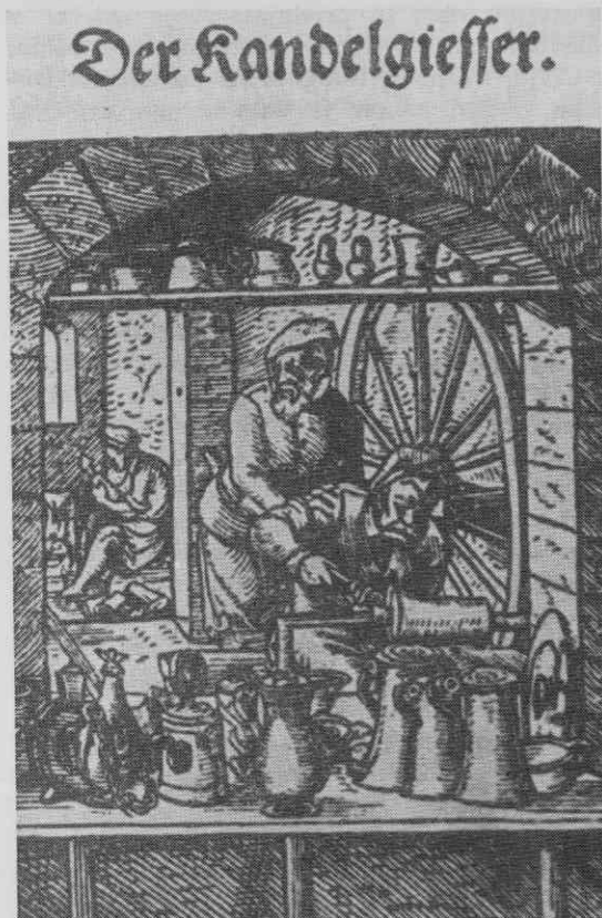
Sl. 1. Kositrarska delavnica iz XVI. stoletja Lesores Iosta Amana v knjigi »Popis vseh stanov« iz l. 1568

prvi polovici XVII. stol. pojavijo tudi na Koroškem in Štajerskem med nemškimi in redkimi domačimi mojstri tudi italijanski priseljenci, ki se v naših deželah ne samo ustale,