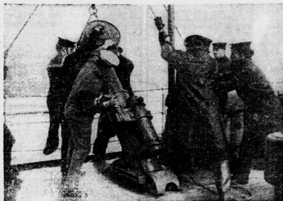
Angleški mornarji spuščajo v morje globinsko bombo

»Kakšno resnico?« je zajecjal Corentin in obraz se mu je zmracil.