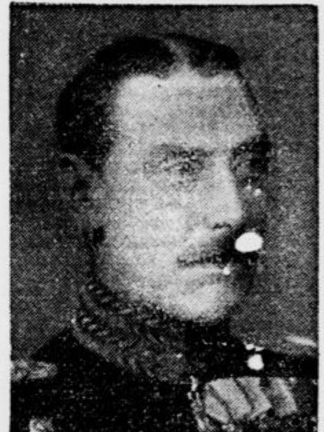
Danski kralj Kristijan