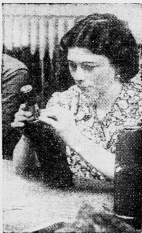
V Nemčiji so zaposlene v tvornicah za proizvodnjo streliva večinoma ženske