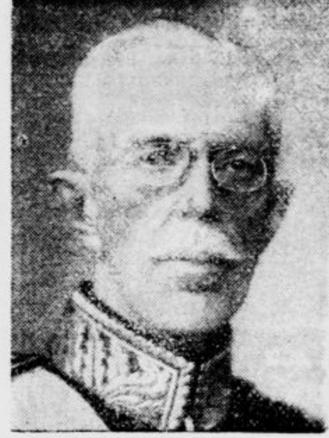
Švedski kralj Gustav V.