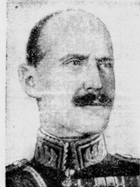
Norveški kralj Haakon VII.