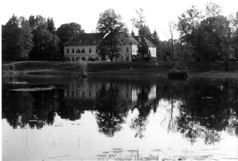
Ribnik pred turniško graščino Fotograf Erwin Urschitz, ok. 1935

Razglasitev sama po sebi ni zadostovala, da bi bili objekti in park primerno zaščiteni in vzdrževani. Dediščino smo začeli izgubljati predvsem zaradi klimatskih razmer, neprimerne vzdrževanja, vandalizma in zaradi nekaterih nespametnih preteklih posegov v spomenik. Leta 2013 je država prenesla lastništvo na MO Ptuj.