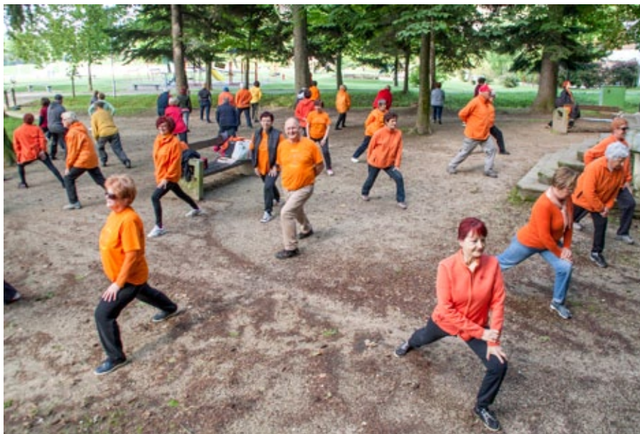
Skupina Ljudski vrt bo junija praznovala peto obletnico delovanja.

Vsak dan (razen ob nedeljah in praznikih) v vseh letnih časih in ob vsakem vremenu v Ljudskem vrtu pri paviljonu telovadijo člani društva Šola zdravja. Polurno vadbo začnejo ob 8. uri. Vaje so preproste in primerne za vsakogar, zato medse vabijo vse, ki želijo nekaj narediti za svoje zdravje.