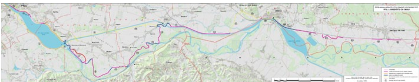
Predlog umestitve Dravske kolesarske poti od Ptujja do hrvaške meje