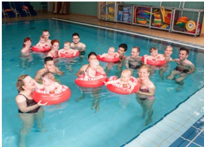
Starši vodijo otroke skozi vaje, dojenčki pa na vadbi okrepijo tako svoje telo kot tudi socialne stike.

V okviru desetih obiskov pri otrokih spodbujajo sonožni udarec, dojenčki povečajo samozavest s samostojnim premikanjem, okrepijo socialne stike in svoje telo, tako psihično kot fizično. Vadba v vodi namreč lahko veliko pripomore k ohranjanju zdravja. »Otrok, ki redno plava, se bolje in hitreje razvija, si krepi mišičevje in srčno-žilni sistem, ima boljši tek in bolj mirno spi. Ob redni vadbi v vodi se izboljša sposobnost termo-