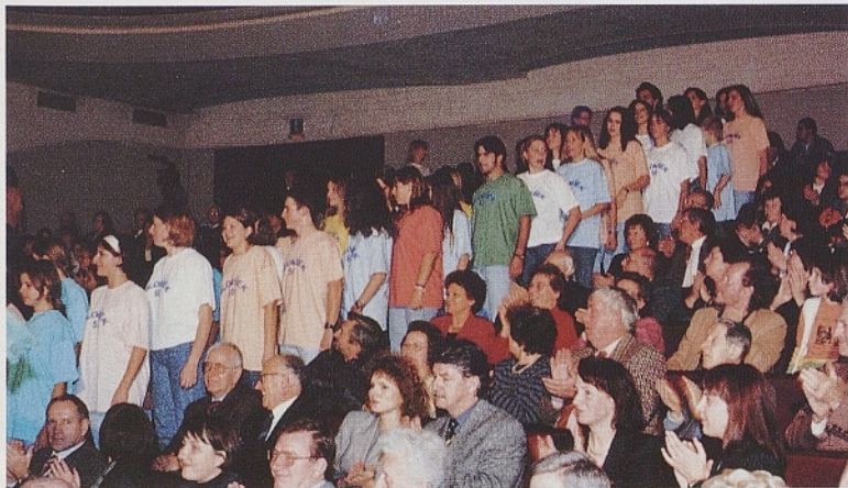
S proslave ob 50-letnici učiteljskega Pedagoškega liceja "Anton Martin Slomšek".