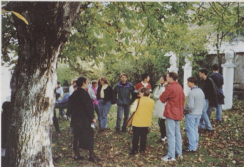
Člani gledališkega kroška SKK na vrtu Goršetove domačije v Svečah na Koroškem.

Naslednji dan, 12. oktobra, so se igralci Tajnega društva PCG z nekaterimi klubovci odpravili na Koroško. Zjutraj smo si ogledali nekatere koroške kraje, popoldne pa so