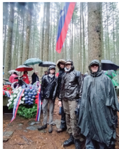
Skupina članov MNOB na Osankarici

Spominke slovesnost na prizorišču bojišča Pohorskega bataljona pri Treh žeblih na Osankarici na Pohorju je organiziral Zavod za kulturo Slovenska Bistrica v sodelovanju z občino Slovenska Bistrica. Slavnostni govornik je bil predsednik Državnega sveta Marko Lotrič. V kulturnem programu sta nastopila KUD Gaj Zgornja Polskava in MOPZ Obrtnik Slovenska Bistrica - Polskava. S. B.