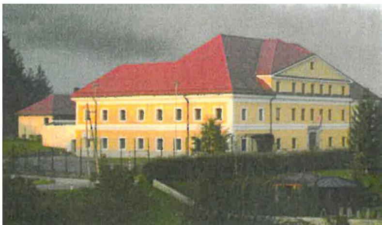
Auerspergerjev grad – sodnija v Višnji gori.

stojanka z nemško četo in nemškimi oficirji za zvezo je bila v nekdanji Auerspergovih graščini. Ker je bilo v njej od leta 1900 okrajno sodišče, smo stavbo imenovali Sodnija.