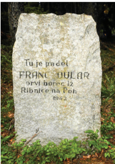
Spomenik na Lepenarci na Pohorju