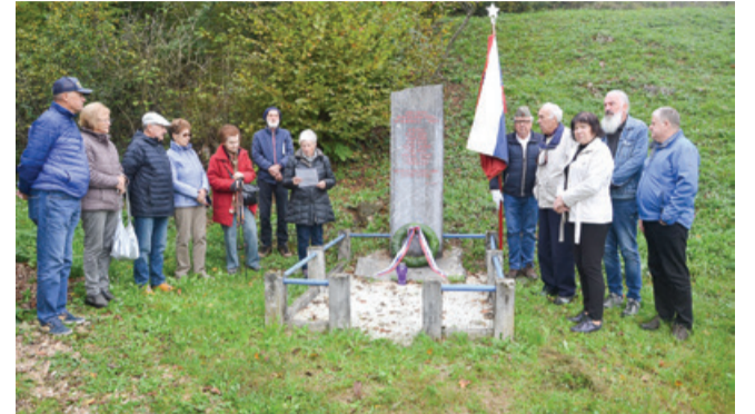
Spomenik devetim talcem v Veliki Ligojni

Z našimi gostitelji smo se odpeljali do enega od izvirov Ljubljane, do Močilnika. Od tam smo se po gozdni poti povzpeli na Drčo, to je grič nad Vrhniko. Tam stoji mogočen spomenik v obliki razrušenega mosta - delo