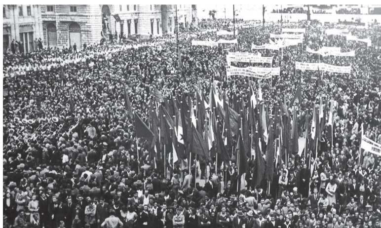
Manifestacija ob osvoboditvi Trsta, 2. maja 1945

V sodobni zgodovini Slovencev in Slovenije je torej 10. februar 1947, ko je bila podpisana mirovna pogodba med zavezniki in Italijo, eden najpomembnejših datumov. Med najpomembnejšimi določili pogodbe je sprememba italijanske vzhodne meje, določene z Rapalsko pogodbo novembra 1920. V skladu z njo je Jugoslavija (in v njenem okviru Slovenija ter Hrvaška) priključila velik del ozemlja, ki ga je zahtevala na mirovnih pogajanjih. Na to odločitev zaveznikov je pomembno vplival prispevek slovenskih partizanov k zavezniški zmagi in so bila v precejšnji meri uresničena pričakovanja primorskih Slovencev, ki so se množično udeležili boja za zmago nad fašizmom in nacizmom ter za narodno osvoboditev. Navdušenje nad spremembo meje je nekoliko zagrenilo dejstvo, da vse jugoslovanske zahteve niso bile sprejete, zlasti boleča je bila izguba Gorice. Z mirovno pogodbo je bilo tudi ustanovljeno Svobodno tržaško ozemlje (STO), ki je do Spomenice o soglasju oktobra 1954 ostajalo