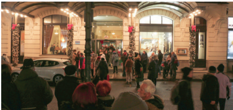
Koncert pred glavnim vhodom v hotel Union v Ljubljani

Koncert slovenskih narodnih in ponarodelih pesmi je izražal ljubezen do rodne grude in netil željo po uporju slovenskega naroda. Vrhunec prvega dela koncerta se je razvil ob Jenkovi Lipi, ki je od tistega večera v brk tedaj prisotni okupatorjevi oblasti postala sino-