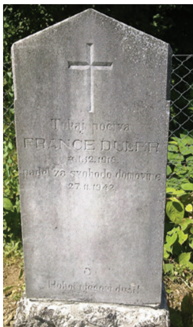
Nagrobnik v Ribnici na Pohorju