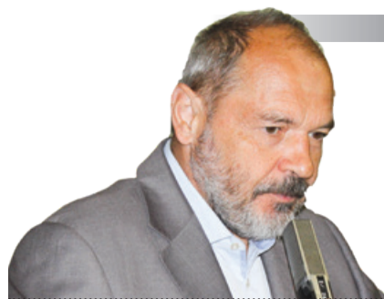
Dr. France Križanič