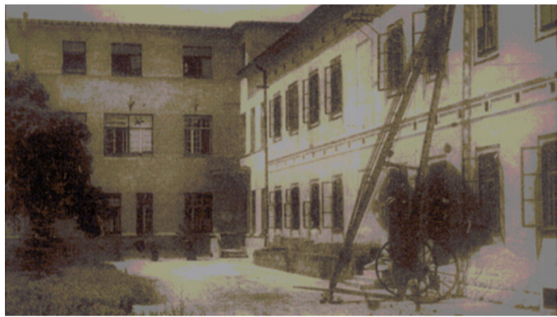
Varen oddelek na Studencu 1942. Danes je v njem oddelek za gerontopsihiatrijo.