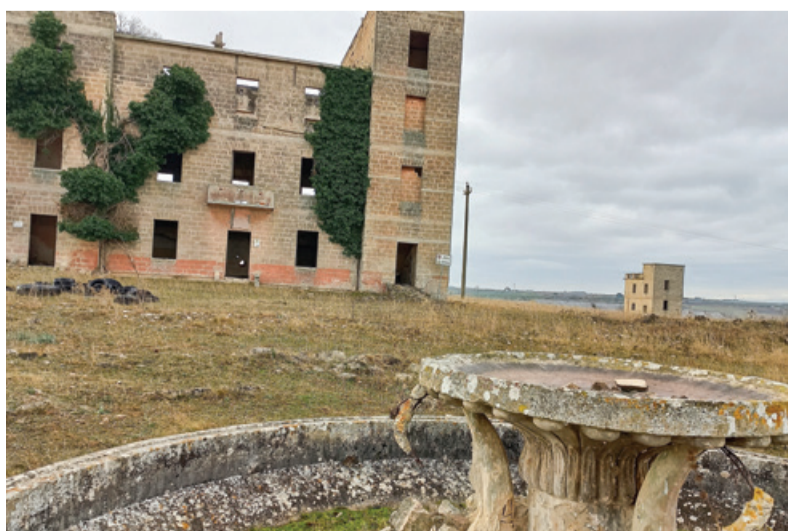
Stavbe nekdanjega taborišča Campo 65 nezadržno propadajo.

Ostanki Campa 65 so med mestoma Altamura in Gravina. Taborišče je bilo načrtovano za 12.000 ljudi, merilo pa je kar 30 hektarov. Tam je bila urejena vsa osnovna infrastruktura z barakami, kuhinjo, komando in stražarskimi mesti. Na ograjenem zapuščenem območju je mogoče videti le še nekaj zgradb, komando, stražarske postojanke, predvsem pa sta pomembni dve grajeni stavbi, v katerih so tudi po