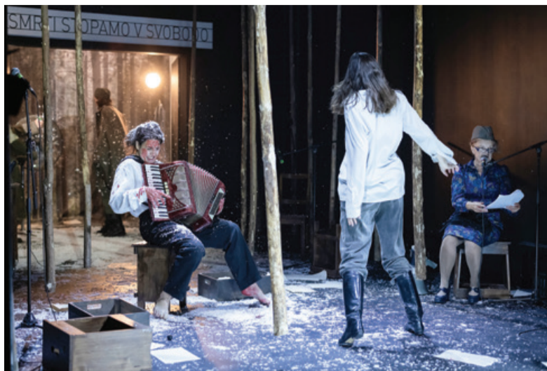
Prizor iz predstave Juriš