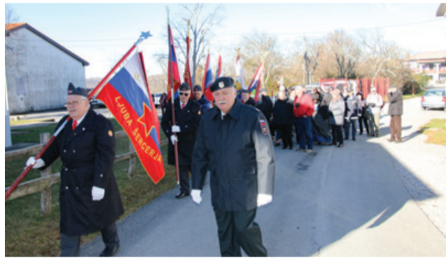
Spominska slovesnost v Tatrah

Tudi lani 25. novembra so se v Tatrah v občini Hrpelje - Kozina zbrali številni obiskovalci spominske slovesnosti in se skupaj poklonili žrtvam druge svetovne vojne, partizanom, ki so jih izdali domači izdajalci, eden celo iz Postojne. Od tragičnega dogodka 13. novembra 1943, ko je bila požgana tudi vas, mineva že 80 let, a spomini niso zbledeli. Neenak boj s sovražnikom sta bojevala 3. bataljon Šerčerjeve udarne brigade in Tomšičeva brigada. V tej kruti bitki za svobodo primorskega naroda je žal umrlo veliko borcev. Njihova imena so vklesana na spominski plošči na tamkajšnjem pokopališču in na pročelju nekdanje osnovne šole. V tej stavbi je od leta 1980 do 1991 imela svoj sedež slovenska Teritorialna obramba.