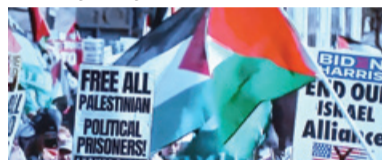
Demonstracije po svetu zoper izraelski genocid nad Palestinci

da ne kaznovano ubije vsaj petkrat toliko sonarodnjakov, someščanov, sovaščanov, sorodnikov in družinskih članov napadalcev, kolikor je sama imela žrtev. Vendar so voditelji Izraela in ZDA že večkrat složno izjavili, da bo izraelsko klanje Palestincev v Gazi trajalo, »dokler ne bodo uničili Hamasa«, temu pa so vse zahodne politične lutke samo prikimavale, nobena ni oporekala. Po tem zadnjem podatku sklepajoč, se torej člen o samoobrambi v »mednarodnem pravu« očitno glasi tako: vsaka napadena država ima pravico, da ne kaznovano ubija vse sonarodnjake, someščane, sovaščane, sorodnike in družinske člane napadalcev, dokler ne ubije dejanskih krivcev!!!