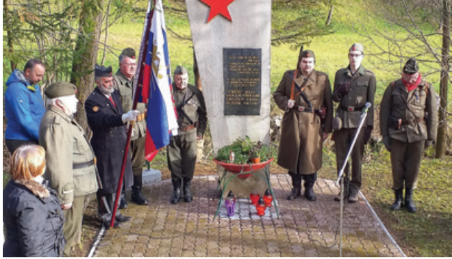
Spominska slovesnost v Bobnu nad Hrastnikom

16. decembra lani je KO ZB za vrednote NOB Rudnik Hrastnik v Bobnu nad Hrastnikom pripravila krajšo slovesnost. Na slovesnosti so sodelovali tudi otroci in Revirska spominska četa.