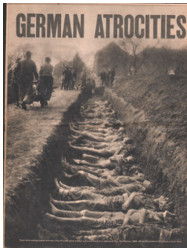
Pokop žrtev in velik naslov v časopisu, da gre za nemške zločine.

činov«. Med njimi je tudi slika poboja 1300 političnih jetnikov iz vse Evrope, ki so bili v nacističnem taborišču Boelke Ka-