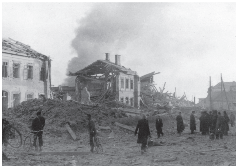
Glavna železniška postaja v Mariboru po bombnem napadu 19. novembra 1944

Ko pišemo o dogajanju na slovenskem Štajerskem v letih druge svetovne vojne, ne moremo mimo tretje dimenzije vojne, kot običajno imenujemo vojno v zraku. Spopad za prevlado v zraku je bil že od začetka vojne eden odločilnih dejavnikov na kopnem in morju. Če je bila v prvih treh letih nemška Luftwaffe gospodarica neba na vseh bojiščih, se je leta 1942 razmerje sil v zraku odločilno obrnilo na stran zaveznikov. Takrat je britansko-ameriško letalstvo začelo širokoptezno strateško in taktično bombardirati Nemčijo in ni prenehalo vse do konca vojne. Kljub ogromnemu krvnemu davku in neprecenljivi