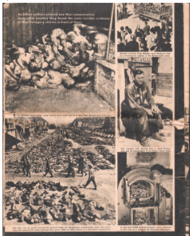
Časopis 1. US Army z dne 1. junija 1945, ki prikazuje zločin v Nordhausnu.

Vsaj zadnja tri leta na dan oktobrske revolucije 7. novembra v oddaji Na današnji dan objavljate slike »komunističnih zlo-