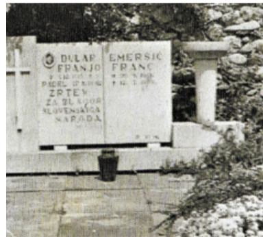
Nekdanji spomenik v Šentjanžu pri Dravogradu