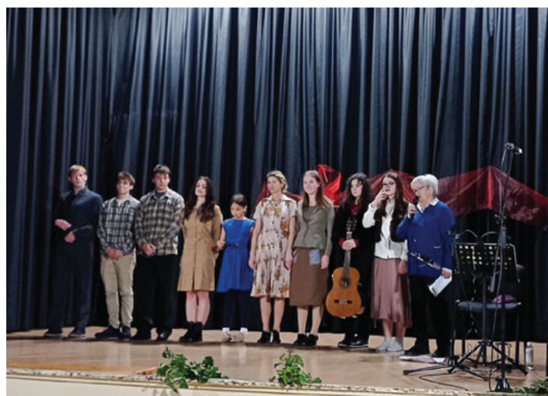
V predstavi so nastopili mladi koprski gimnazijci.