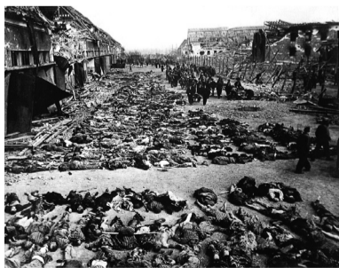
Mrtvi taboriščniki po angleškem bombardiranju – slika je vzeta s spletne strani.

činov«. Med njimi je tudi slika poboja 1300 političnih jetnikov iz vse Evrope, ki so bili v nacističnem taborišču Boelke Ka-