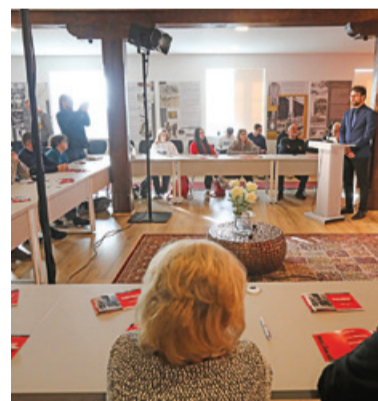
Del udeležencev konference