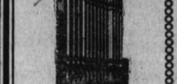
Podružnica: 11 BROADWAY, NEW YORK... za udobnost rojakov, v sger... njem delu mesta.