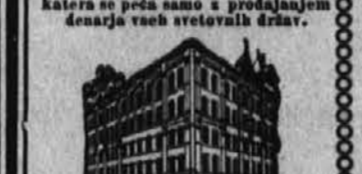
Podružnica v Pittsburgu: 609 SMITHFIELD STREET, PITTSBURG, PA.