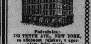
Podružnica: 783 TENTH AVE., NEW YORK... za udobnost rojakov, v sger... njem delu mesta.