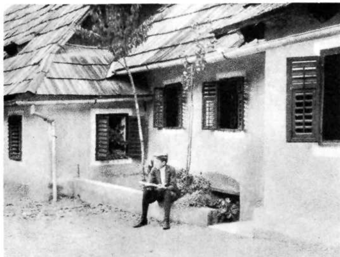
Novo mesto: Študentovska ulica

vzel v svoje delo Vrhovec (prim. str. 137—139), le da ga je z nekaterimi podatki in imeni izpopolnil ali popravil. V pripombi, napisani najbrž 1797., opisuje Breckerfeld tudi prihod prve francoske patrolje v Novo mesto — 4. aprila 1797. — in hvali meščane, ki so prepodili Francoze (prim. Vrhovec 159/160, B. trdi, da je bilo francoskih konjenikov 36, V. po svojih virih piše o 14).