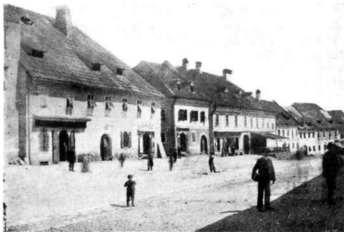
Novo mesto: Glavni trg (srednji del leve strani)

(16) »Iz bilance je razvidno, kako slabo je z mestnimi dohodki. Ali tu ni pravo mesto, da bi k temu delal politične pripombe, ko je namen tega spisa le v topografskem opisu podati zgodovino kraja. Samo to naj povem, da so pred postavitvijo okrožnih gla-