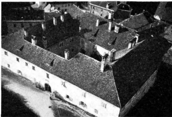
Novo mesto: Pogled s kapitelskega zvonika na proštijo