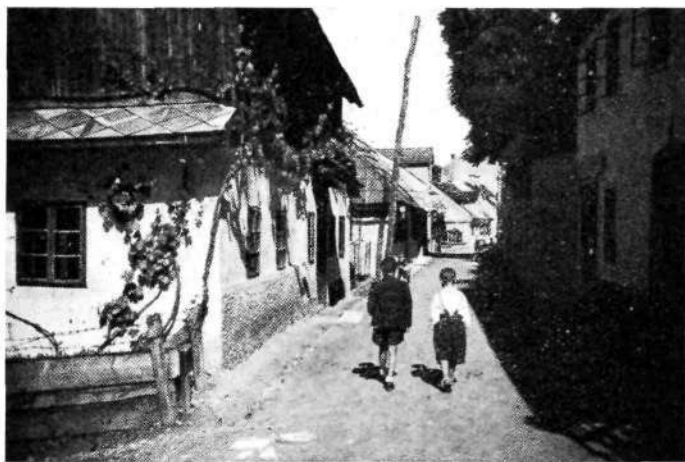
Novo mesto: Vrhovčeva ulica (Dolga ulica)