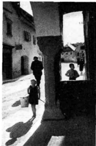
Novo mesto: Ljubljanska cesta. Pogled izpod Bergmannovih arkad