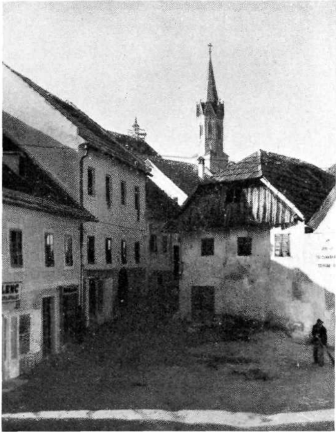
Novo mesto: Ustje Kastelčeve ulice ob Ljubljanski cesti. (Pod Sv. Katarino)