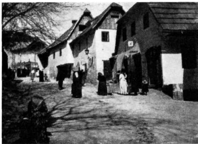
Staro Novo mesto: Karlovska cesta

V začetku XIX. stoletja so kranjski deželni stanovi imenovali Breckerfelda za polnomočnega komisarja ob priliki davčne regulacije v pazinski grofiji (1803.) in potovanje po Istri mu je dalo snovi za rokopis o Istri in tamkajšnjih razmerah. Tri leta nato pa je umrl v Ljubljani dne 30. januarja 1806., star 66 let.