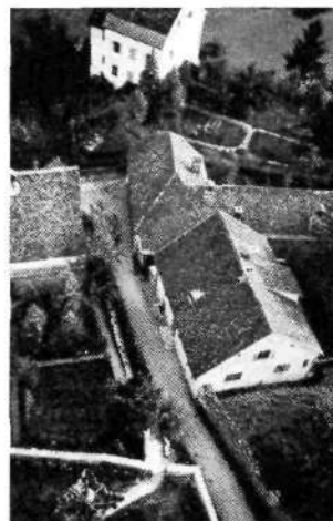
Novo mesto: Pogled s kapiteljskega stolpa na del Križatijske ulice