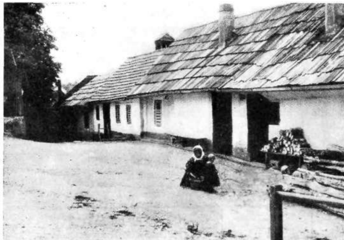
Novo mesto: Breg

Slike na str. 103 in 104 posnete iz albuma fotografa A. Suppana (v šestdesetih ali sedemdesetih letih XIX. stol.).