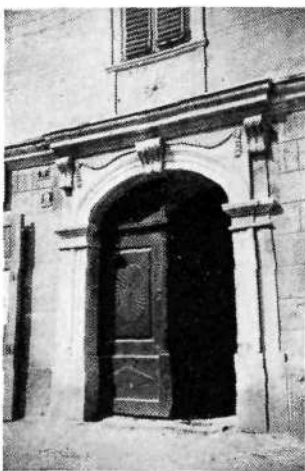
Novo mesto: Trg kralja Petra II. (Glavni trg). Portal Germove hiše