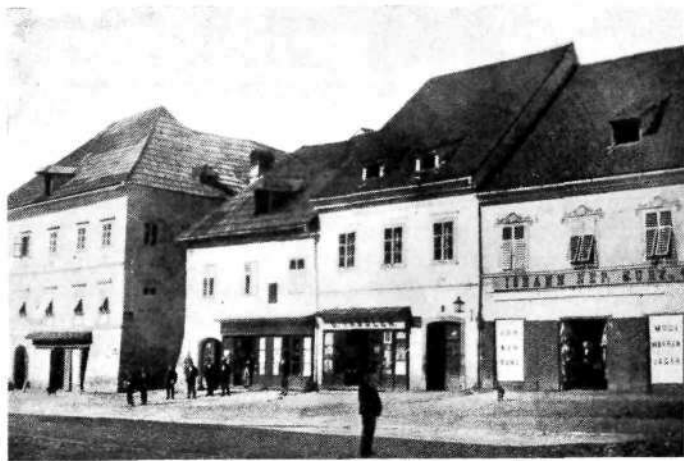
Novo mesto: Glavni trg (srednji del desne strani)