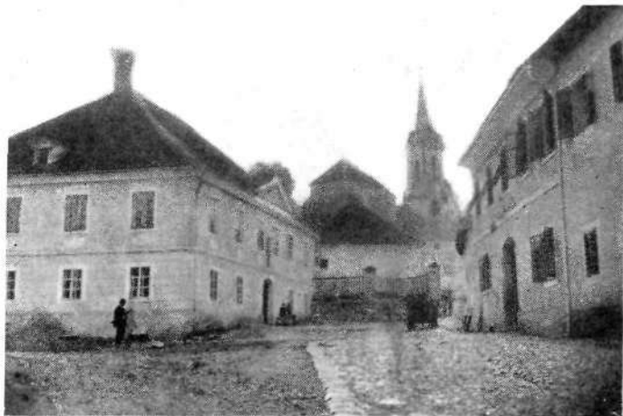
Novo mesto: Trg sv. Florijana (Sredi XVIII. stol.: Pri sv. Antonu)

Blizu tega nagrobnika je bil drugi rodbine Gregorič z napisom: