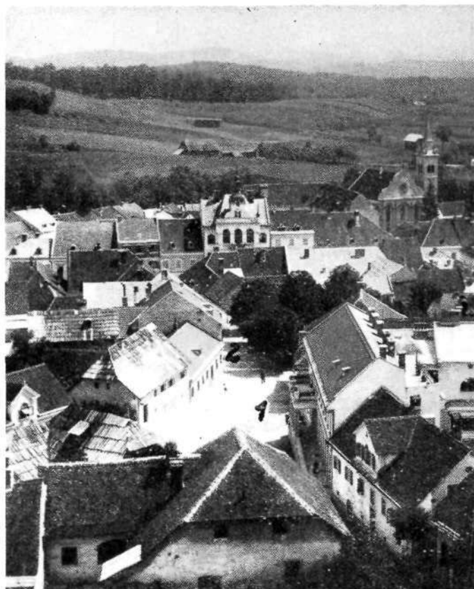
Novo mesto: Trg sv. Florijana (s kapiteljskega zvonika)

1. Pri pečnici. 2. Pri sv. Antonu (Florijan)