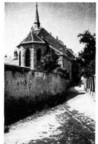
Novo mesto: Jenkova ulica (Pri frančiškanih)