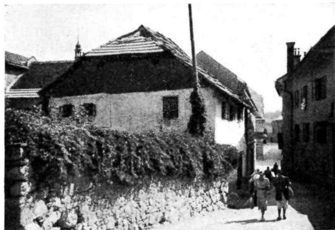
Novo mesto: Križatijska ulica (Poskokengasse)