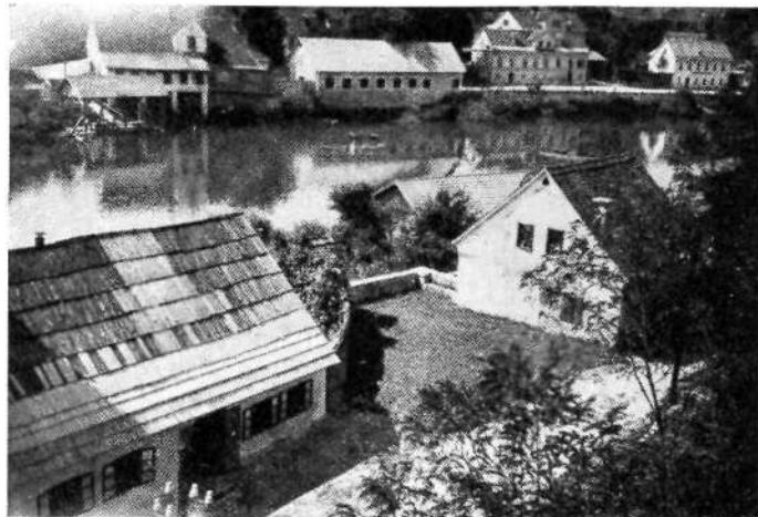
Novo mesto: Pugljeva ulica (Karlovska, predtem Kovaška cesta, še preje Pri mesnicah). Dohod na bivši leseni most, desno od njega nekdanja mestna mesnica

Hier liegt begraben der edel und veste Wilham von Villanders zu Wördl der letzte deß Zunamen, gestorben am Charfreytag 1547. Und sein Vater Sigmund Villanders ist auch hier begraben 1520. Dem Gott genade.