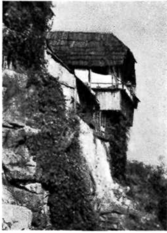
Novo mesto Hiša na Bregu

velja. Vrhovcu ni podrla vseh dvomov niti dejstvo, da je avtor sam, čeprav samo z začetnicami, signiral svoje delo.