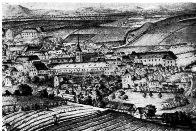
Oton Škola: Novo mesto 1836. (severovzhodni del)

Levo nad samostanom cerkev sv. Antona (Florijana), nad frančiškansko cerkvijo Ljubljanska vrata in cerkev kapucinskega samostana, desno od samostana vojašnica, desno pod samostanom mestni stolp