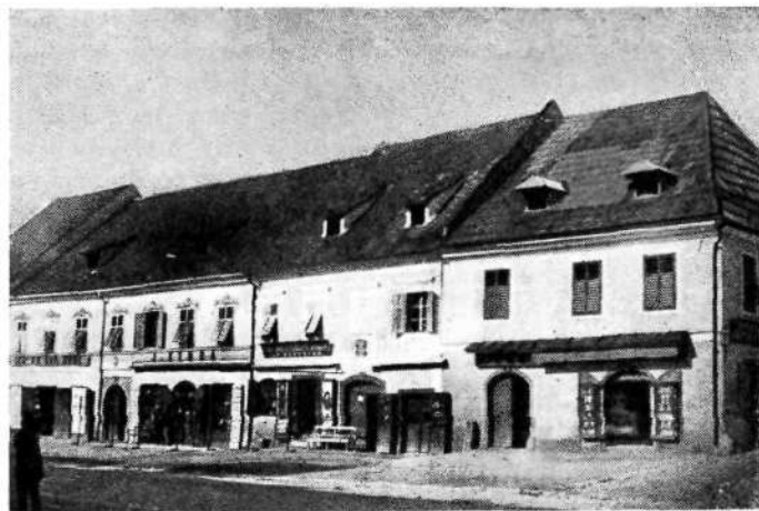
Novo mesto sredi XIX. stol. Glavni trg

varjev nadzorovali mesta deželni vicedomi, in mesta so takrat, vsaj to Novo mesto čisto gotovo, živelja v mnogo ugodnejših razmerah kot poslej.«