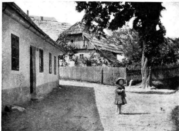
Novo mesto: Pred vojašnico