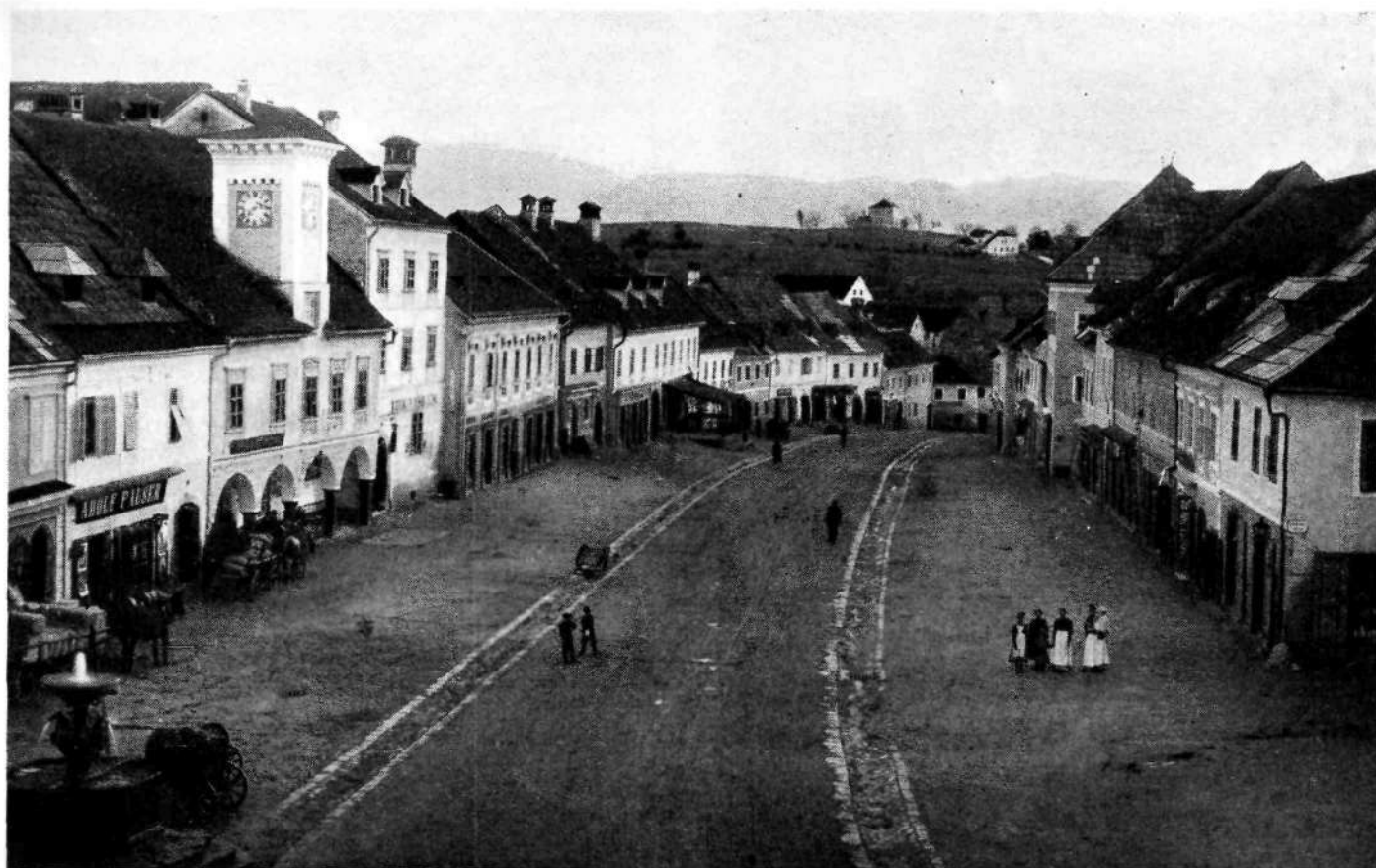
Novo mesto: Glavni trg (1895.)