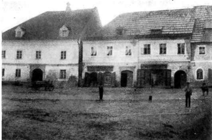
Novo mesto: Glavni trg (gorenji del desne strani)