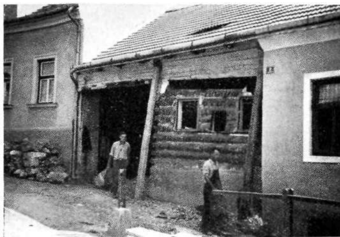
Novo mesto: Ulica 6. septembra (Tesarška ulica). Milačeva hiša (Stena prvotne mežnarije pri cerkvi sv. Jurija; mala okenca — srednje še vidno — so bila pred kakimi petdesetimi leti zabitna in izrezana večja. Podrto dne 5. avgusta 1938.)