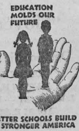
BETTER SCHOOLS BUILD A STRONGER AMERICA