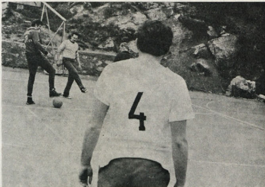
Zdrav duh v zdravem telesu. Tega se naši nogometni ekipe zavedata. Na sliki prizor iz nogometne tekme med upravo in proizvodnjo