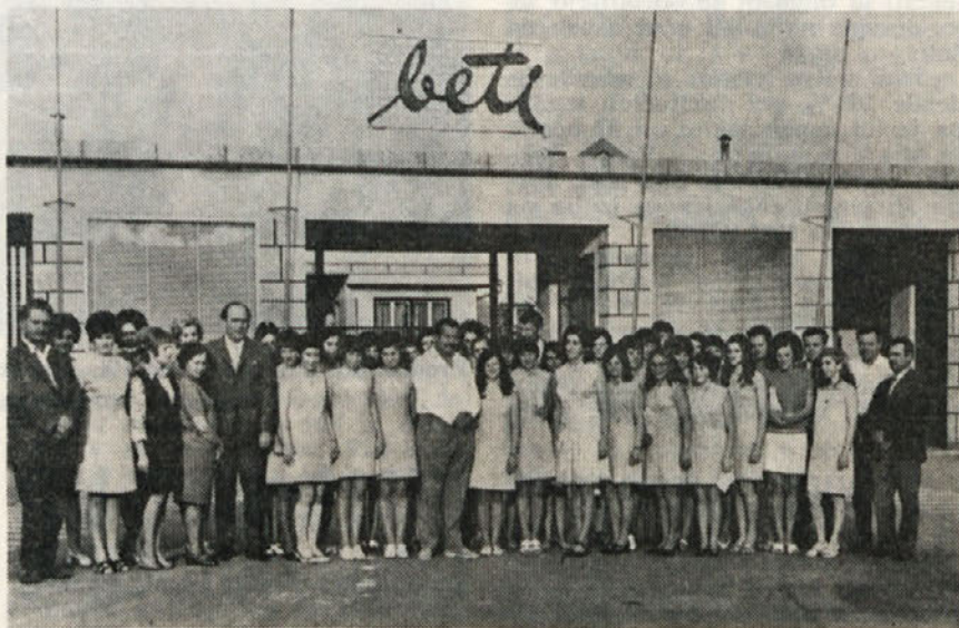
Spominska fotografija posneta po zaključnih izpitih na Poklicni šoli. Poleg učenc so na sliki še predavatelji, predstavniki Tekstilnega centra Kranj in člani izpitne komisije