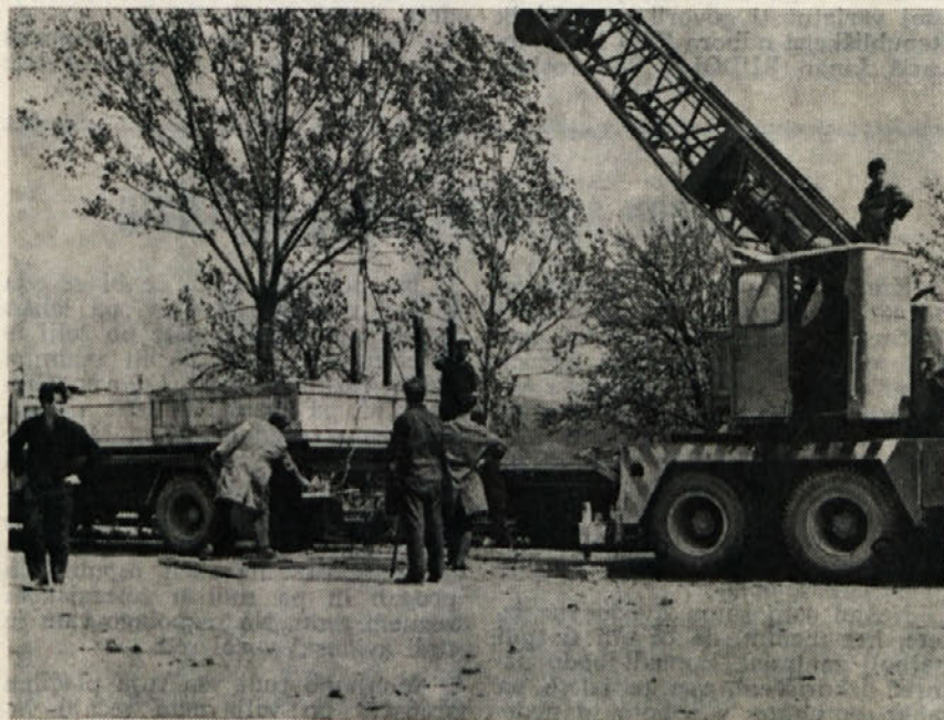
Proizvodnja v obratu kodranka bo kmalu stekla. Na sliki vidimo razkladanje strojne opreme, ki jo je pripeljal poseben vlak iz Francije v Metliko