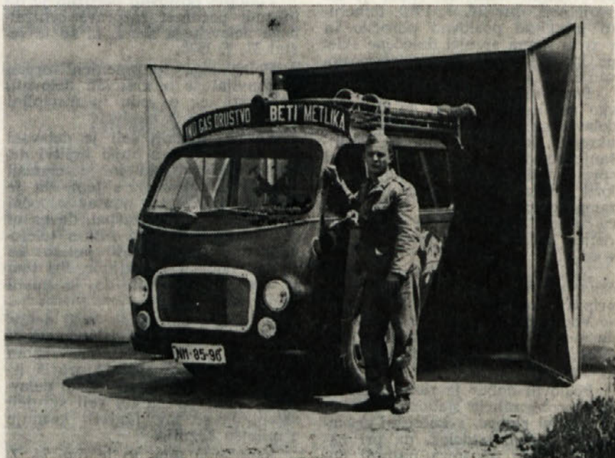
Tine Fir skrbi med drugim tudi za naš gasilski avtomobil

V imenu naših bralcev in članov kolektiva želimo našim gasilcem, da se čim bolj izkažejo in prinesejo s tekmovanja diplomo, s katero bo poplačan njihov trud na vsakodnevni njihovi vajah.