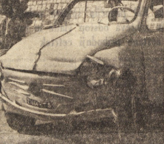
Tak je bil Cogojev avtomobil, potem ko je trčil v neprevišnega kolesarja

V Krogljah sta trčila dva motorja - Z motorjem je zavozil prevec na desno in je z desno nogo zadel v občestni kamen