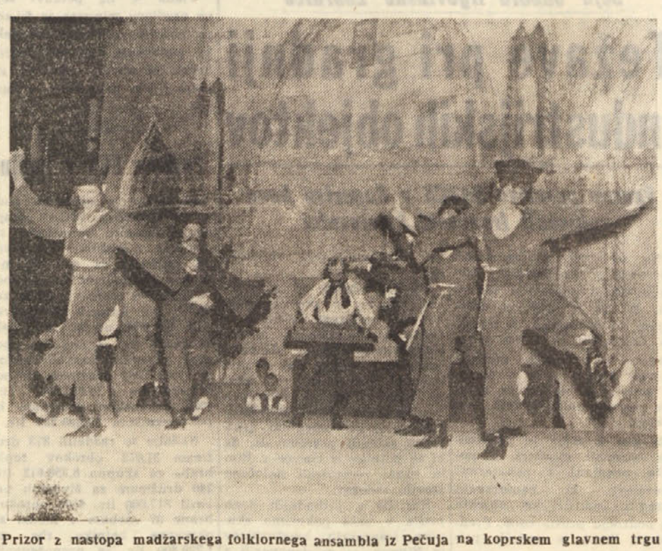
Prizor z nastopa madžarskega folklorne ansambla iz Pečuja na koprskem glavnem trgu