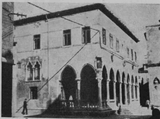
Zahodna stranica loggie s kasneje dodano gotsko biforo