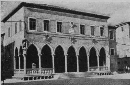
Loggia v Kopru