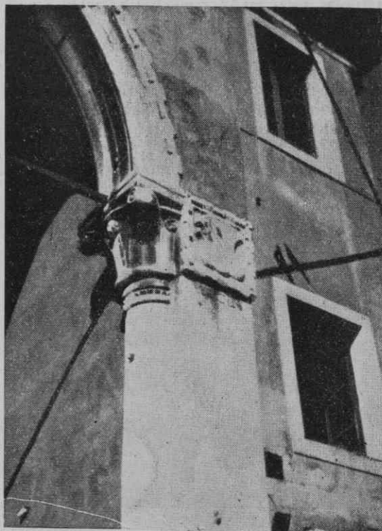
Vogalni pilaster z grbom in letnico 1464