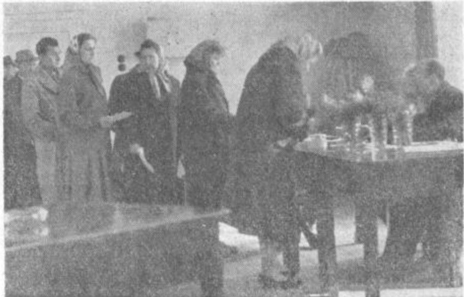
Ze v zgodnjih jutranjih urah so čakali, da pridejo na vrsto. Predvsem so se izkazali v Saleku, saj so stoozdostno volili že do osme ure. Ta posnetek je zgovern dokaz, kako so prebivalci Velenja zavedni.