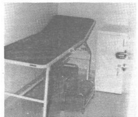
Pogled na del nove ambulante na Igu