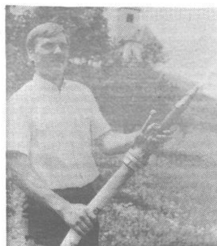
Prvi curki vode na Koreni