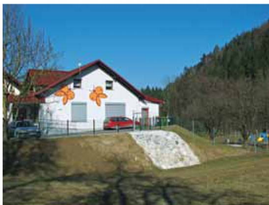
Enoto Vrtca Zala na Dobravi od septembra obiskuje 45 malčkov v treh skupinah, februarja 2011 pa se jim bo pridružila še ena skupina, v kateri bo 14 otrok. V letu 2010 so bili v vrtec sprejeti vsi otroci iz občine, ki so izpolnjevali pogoje za vpis.

Prav toliko, 300 let, je minilo tudi od dograditve cerkve sv. Tilna v Javorjah. Prireditve so se vrstile vse poletje, izšla je tudi knjiga izpod peresa Milene Alič. V njej med drugim opisuje javorsko faro in njena naselja, cerkev sv. Tilna in njene podružnice, zgodovino, poglavje je namenjeno cerkveni in upravni ureditvi,