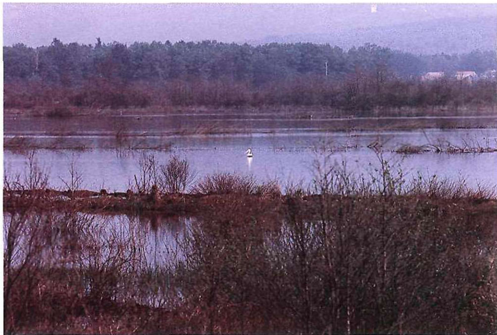
Zadrževalnik Medvedce

Do zadrževalnika lahko pridemo na dva načina. V obeh primerih je naše izhodišče Pragersko, vas, ki leži ob cesti Slovenska Bistrica – Ptuj. V prvem primeru prečkamo železniško progo v smeri proti Ptuj in na prvem ostrem