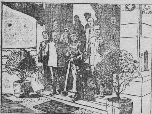
Der Hetmann der Ukraine General Skoropadski zu Besuch bei General-Ludendorff und General Ludendorff.

poročajo, da so dospele avstro-ogrski čete v Sofijo.