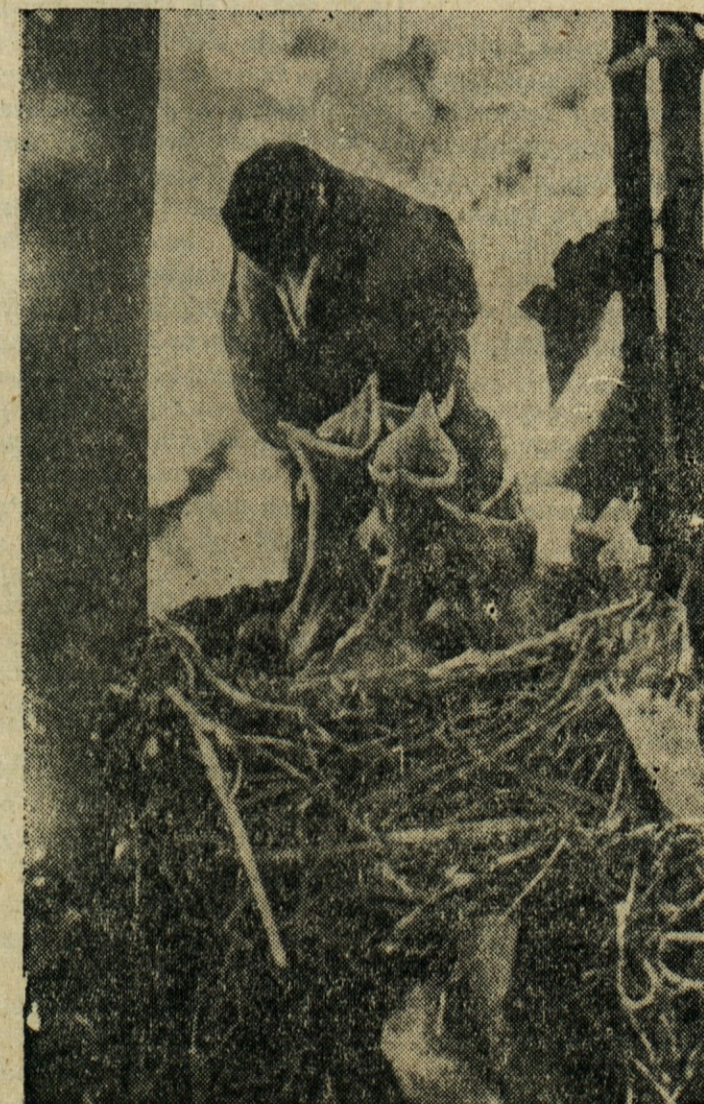
LACNI KLJUNI! — Samica robina ob gnezdu s štirimi lačnimi mladiči v Winston-Salem, N. C.

ki so umrli 24. julija 1953 Prosite ljubega Boga za nas in ko pride pa poslednji čas, da vsi enkrat spet se snidemo, ter vso večnost veselje uživamo.