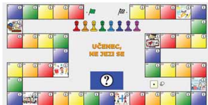
Slika 1: Izgled igre s kocko za utrjevanje znanja.

Sobo sem grafično pripravila v Google predstavitvi. Za osnovno sem vzela sliko učilnice, kamor sem dodala elemente, povezane z verjetnostjo in statistiko in jih naredila aktivne – ob kliku nanje se je odprla nova stran (Google dokument, povezava do filmčka,