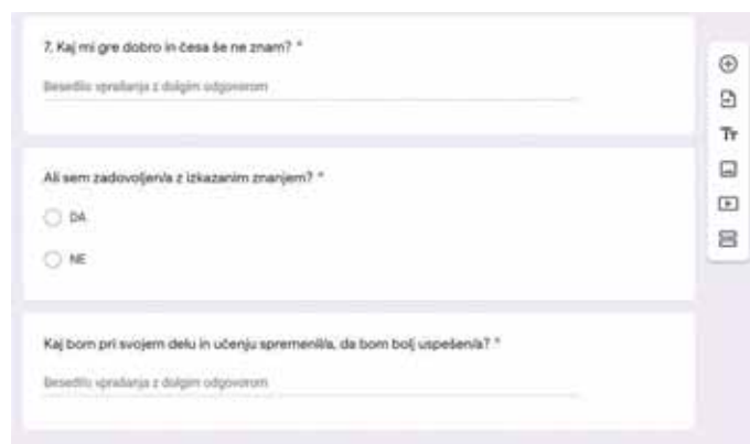
Slika 8: Primer vprašanj za povratno informacijo o delu učenca.