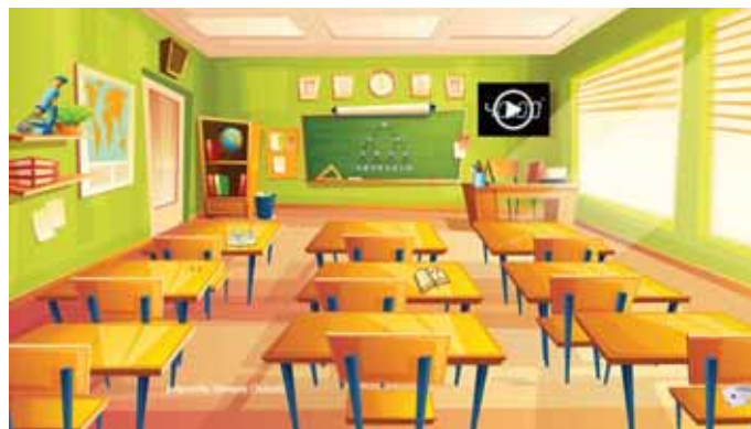
Slika 5: Primer slike učilnice za sobo pobega.

youtube stran ...). Aktivni so bili tudi nekateri deli celotne slike. Ob strani pa je bil odštevalnik časa.