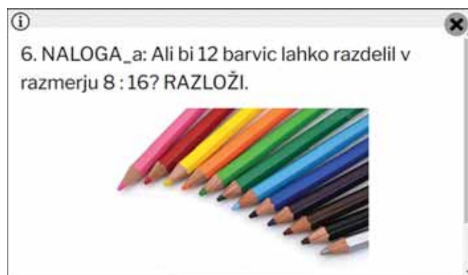
Slika 2, 3, 4: Kartice presenečenja in primer naloge.