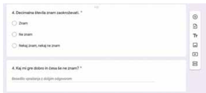
Slika 7: Primer vprašanj za povratno informacijo o doseganju ciljev.

Za kratke evalvacije sem uporabljala tudi orodje Padlet in Mentimeter (Slika 9).