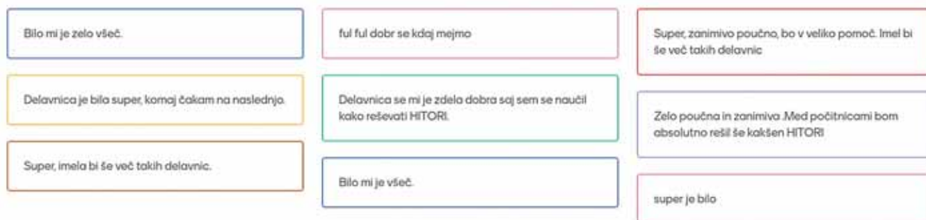
Slika 9: Primer evalvacije učencev po izvedeni delavnici.

Pri zadnji nalogi pa so učenci metali 2 igralni kocki in si beležili izide. Izračunali so verjetnost oz. relativno frekvenco vnaprej določenih dogodkov.