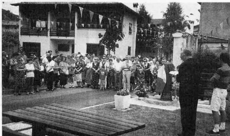
Un momento della cerimonia di domenica ad Azzida

Per la gente che ha assistito all'inaugurazione anche una sorpresa. La fontana, infatti, per tutta la giornata ha fatto uscire dell'ottimo vino bianco.