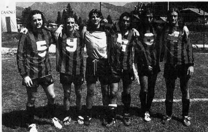
La squadra Strakovič eliminata dal Sempeter

Il torneo ha richiamato un numeroso pubblico nell'arco di tutte le tre giornate di gara che hanno avuto come contorno, dopo le gare, una vera e propria sagra paesana.