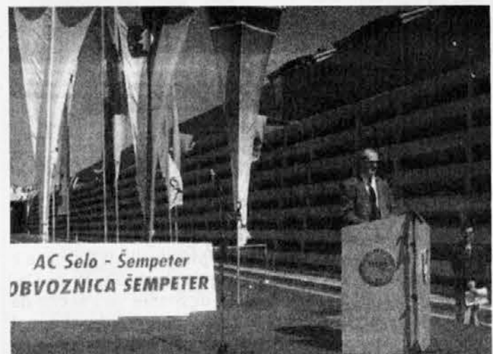
A Nova Gorica, nelle vicinanze del confine internazionale, è stato aperto il nuovo raccordo autostradale per Lubiana

V deželnem svetu se je začela razprava okoli kočljive teme: zakonskega osnutka o deželnih parkih in rezervatih, ki zaobjemajo tudi območja, kjer živi naša narodnostna skupnost. Prvi dan je bil namenjen uvodni razpravi, med katero so svetovalci različnih skupin vnesli več kot 100 popravkov k zakonskem osnutku. Med razpravo so pršla na dan različna gledanja tudi znotraj predstavnikov večinske koalicije. Najbolj se nad zakonskim osnutkom jezijo Zeleni, ki so organizirali tudi protestno manifestacijo.