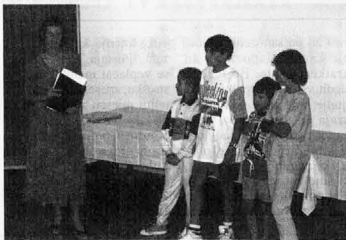
I vincitori del concorso dialettale dell'anno passato

Per martedì 6 in serata il bar Skossa di Oseacco ha organizzato il primo incontro