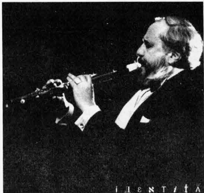
Il clarinetista Giora Feidman ospite del Mittelfest

Il pienone l'ha fatto, sabato sera, l'attore e nar-