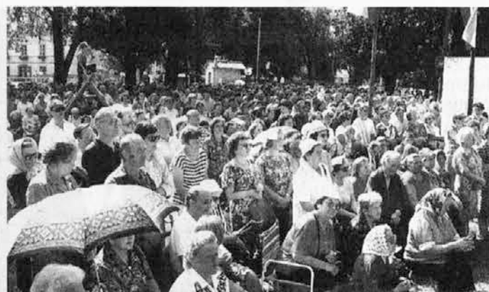
Pogled na množico ob srečanju pred tremi leti v Zabnicah