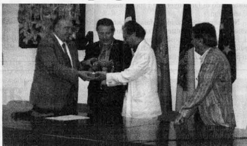
La consegna simbolica del premio al direttore della rassegna Piaggio

La compagnia slovacca "Tradične Babkove Divadlo" ha vinto il premio "Marionetta d'oro" assegnato dall'amministrazione comunale di S. Pietro al Natisono alla migliore compagnia di burattini e marionette che si è esibita nelle Valli del Natisono nel corso del Mittelfest. Il premio è stato assegnato da una