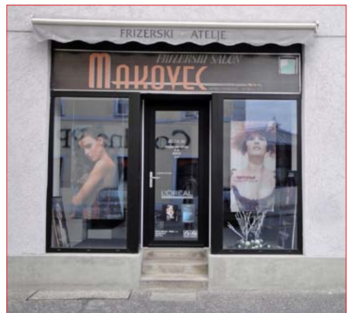
V Mestni občini Ptuj je registriranih kar 652 obrtnikov, od tega jih 18 deluje že več kot 30 let, med njimi jih je 8 iz starega dela mesta. Na fotografiji frizerstvo Makovec.

ktro – elektroinštalacije. Poleg omenjenih obrtnikov je na Ptujju še veliko število drugih obrti oziroma uspešnih obrtnikov, o katerih bomo pisali v prihodnjih številkah.