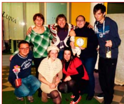
Prostovoljci igralci pravljice Čudežno pletivo

stva. Med vsemi dejavnostmi, ki jih izvajamo prostovoljci