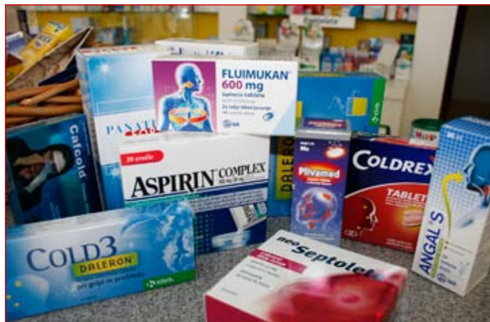
Obnovljivi recepti so tako za zdravnike kot za kronične bolnike dobrodošla novost.

Kontracepcijske tablete na obnovljivi recept ginekologi predpisujejo že od leta 2009. Njihove pacientke so s to rešitvijo zadovoljne, saj gredo tako po recept le še enkrat na leto namesto enkrat na tri mesece, zdravnik pa ima tako več časa za pacientke, ki ga običajno zaradi drugih težav. Ob zdajšnjem širjenju obnovljivega recepta je predvideno, da se lahko ta načeloma predpiše za vse kronične bolezni. Izjema so močna protibolečinska zdravila in psihotropna zdravila, kot so na primer pomirjevala. Za katerega bolnika je obnovljivi recept primeren, pa oceni osebni zdravnik. Novost velja zagotovo pohvaliti, saj bo nedvomno zmanjšala čakalne vrste pred vrati zdravnikov, hkrati pa bodo zdravniki pridobili več časa za preglede in svetovanje bolni-