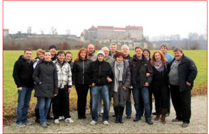
Člani društva Cesarsko-kraljevi Ptuj v družbi gostiteljev iz zgodovinskega društva Herzogstadt Burghausen pred najdaljšim gradom v Evropi