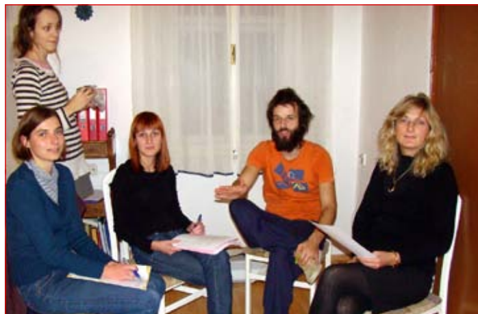
Člani Kulturno-umetniškega društva Jaga baba Ptuj