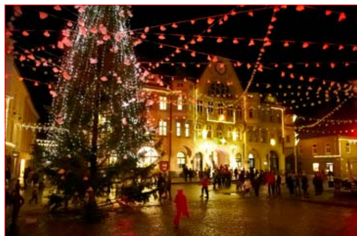
Ptuj je že drugo leto zapored v novoletnem času konceptualno okrašen.

osvetlitev ( svetlobne verige ) po Krempljevi in Miklošičevi ulici. Novoletna okrasitev se bo tako kot lani nadaljevala v pustni čas. Snežno bele rože bodo dopolnjene z barvnimi trakovi, ki bodo oznanjali začetek pustnega časa. Staro mestno jedro bo prav tako, že tradicionalno, okrašeno z nepogrešljivimi »duhovi«, ki jih v ta namen ustvarijo mojstri iz okoliških vasi.