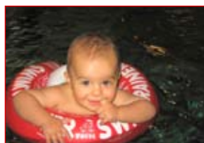
Jaz sem ravnokar preplaval bazen.

V prvem tednu januarja 2012 spet začnemo vadbo. Plavalna zveza Slovenije organizira vadbo v vodi za dojenčke in malčke (od 6. meseca do 4. leta starosti), ki poteka v Termalnem parku na Ptuj. Pred začetkom plavanja bo uvodno predavanje za starše, termin je objavljen na spletni strani. Informacije in prijave po telefonu 051 220 984.