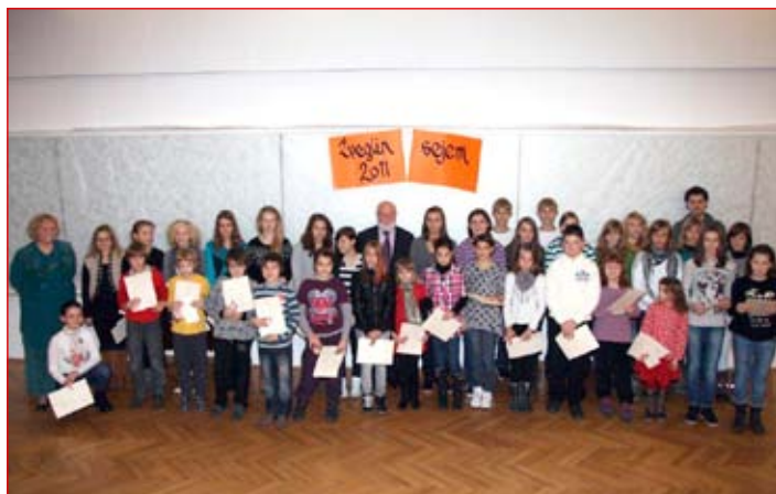
Skupinski posnetek mladih ustvarjalcev z mentorji

Likovniki so svoje izdelke iz gline združili v eno podobo, ki krasi veliko dvorano Narodnega doma, mladi literati pa so svoja dela predstavili v priložnostnem zborniku.