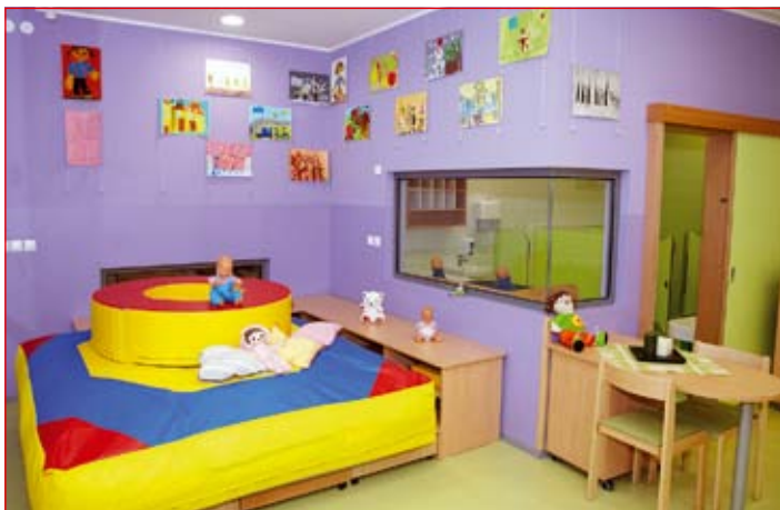
Prijetno urejena notranjost

Trenutno je v vseh enotah ptujskega vrtca vključenih 1.022 otrok, kapacitete pa so bistveno manjše, kot bi sicer morale biti, a ker pravilnik za zdaj dovoljuje, da se kvadratura lahko tudi nekoliko krši, se tega v vrtcu tudi poslužujejo, saj druge možnosti nimajo. Srčno si želijo, da bi obnovo najprej doživeli Mačice, saj se v to enoto ni vlagalo že 17 let. Ravnateljica tudi zmeraj poudarja, da morajo imeti vsi otroci, ki obiskujejo Vrtec Ptuj, enake pogoje.