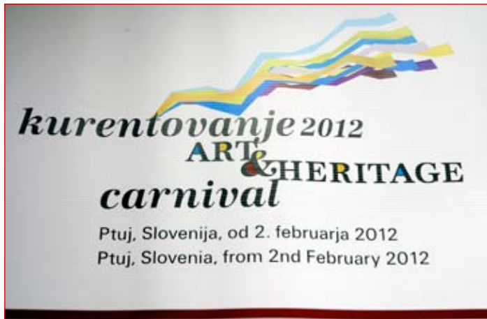
52. kurentovanje 2012 bo razdeljeno v tri tematske sklope: Etnofest, Artfest in Karnevalfest.

enotno raven postaviti dimenzije kurentovanja, ki so bile do sedaj ob karnevalskem delu mogoče nekoliko zastopljene.