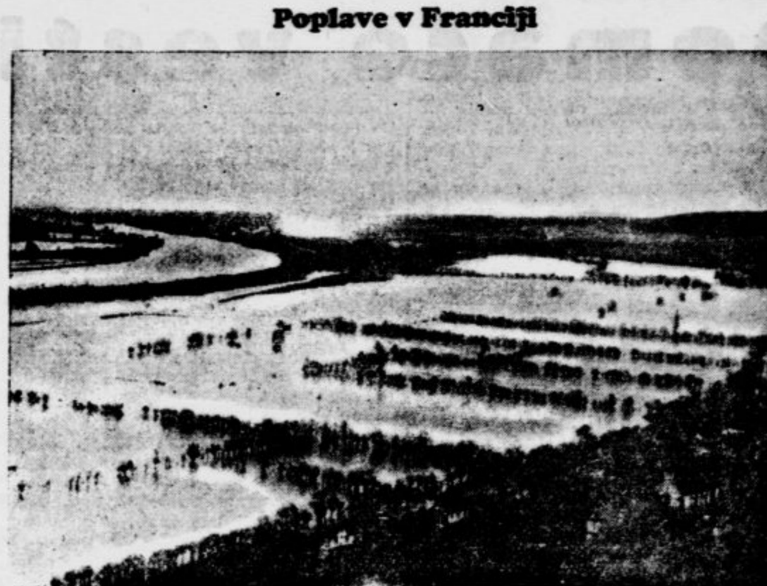
Seina se je razlila čez bregove