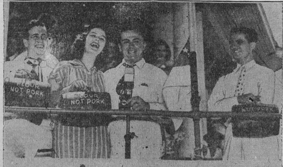
Slika kaže kandidata W. Lee O'Daniela, ki je kandidiral za guvernerja države Texas na svoj poseben način. Vsak dan dvakrat je priredil "radio show", kjer so peli, plesali itd. Kandidata nazivajo za "hillbilly flour salesman". Zraven imajo kolektorji posebne male sodčke, v katere spuščajo ljudje "nikeline" in "dajme", s čemer krijejo stroške za predstave. O'Daniel je zmagal z večino.