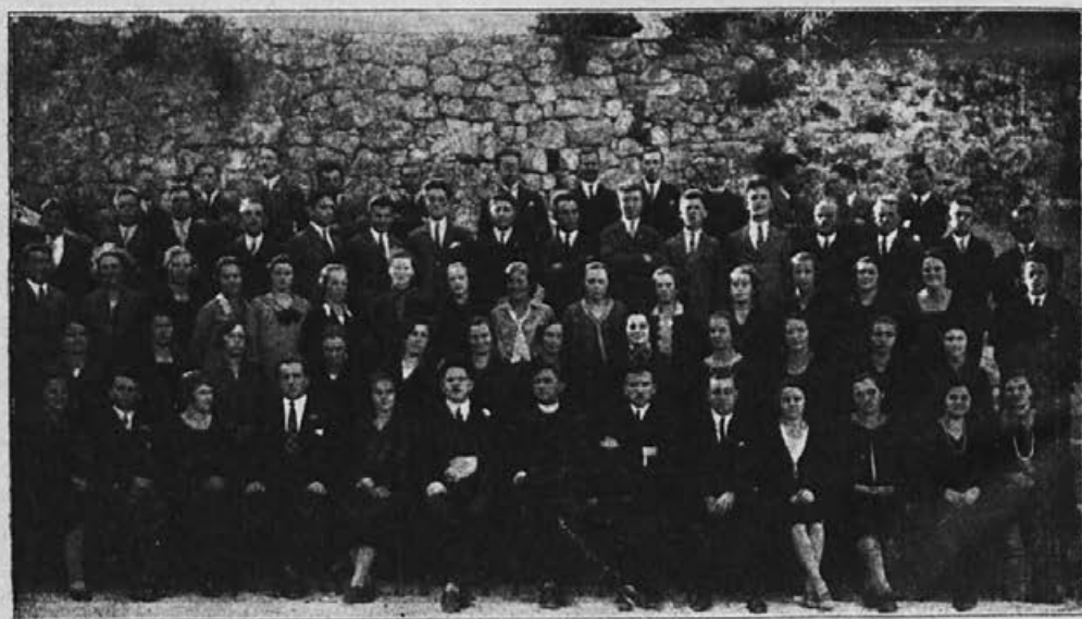
Posavska pevska okrožje ob priliki okrožnega koncerta (30. IX.)