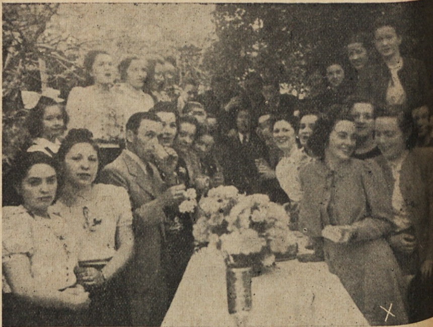
Algunas caras conocidas de “Slovenski dom”

Otrok, ki je v nečem kaznovan, joče v enem kotu. Očka ga gre iskat. Smejoč se in z obema rokama mu vzdigne glavo, naj vsi prisotni vidijo ta razjokani obra-