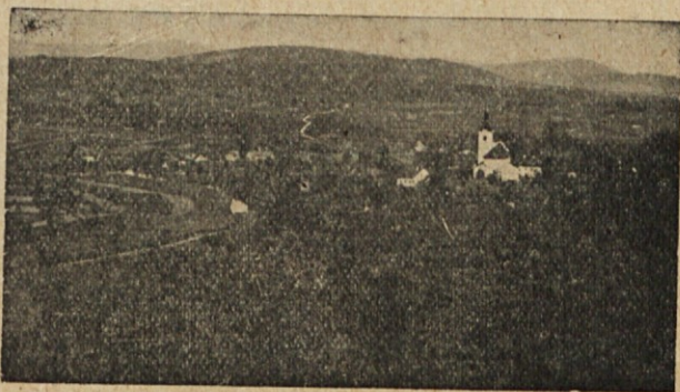
Vrhnika — donde nació Ivan Cankar, uno de los mejores escritores eslovenos.

El peligro actual contribuyó en forma eficazísima para que se unieran todas las fuerzas constructivas nacionales y hoy enfrenta el país la situación peligrosa, más unida que nunca, pero igual más resuelta que nunca en no permitir a nadie que pase sus fronteras.