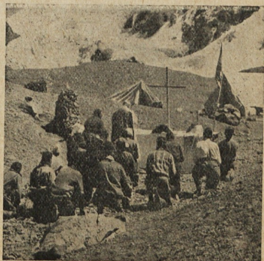
En Plaza de Mulass dijo el Padre Kastelic su última misa. (4300 m)

Una mística unción pone un marco de leyenda a esta escena. El cielo de un azul purísimo, con un sol