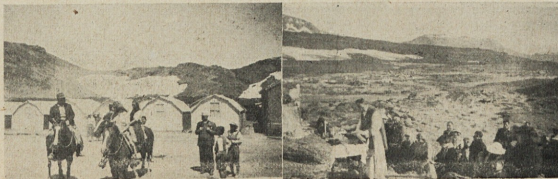
En las montañas de Neuquén.

Od tedaj naprej je pot ves čas oživljena s kako novo sliko. Še se požene cesta v višino in skozi prašno