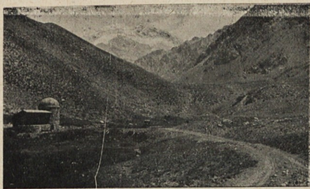
Una vista de Aconcagua desde el Valle de los Horcones

Consecuentes a la indicación se adelantaron los señores Franke, López y Etura.