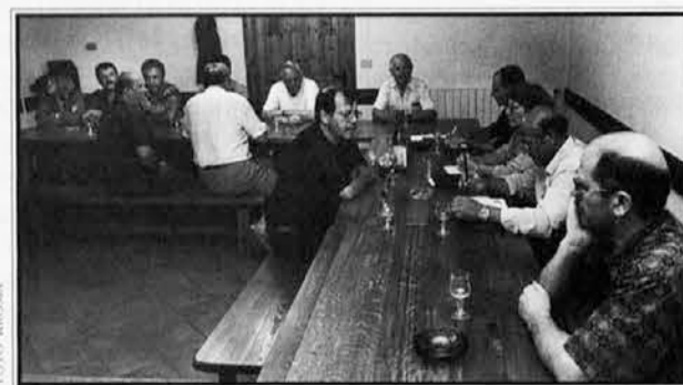
TRNOVCI: udeleženci so obravnavali dosedanje delovanje občinske uprave