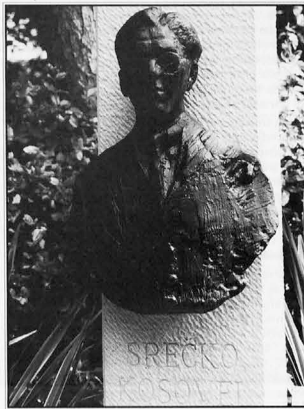
Tržaški ljudski vrt odslej krasi tudi kip Srečka Kosovela

Odkritje spomenika Srečku Kosovelu v središčnem mestnem ljudskem parku, kjer stoji v neposredni bližini spomenikov Italije Svevu, Jamesu Joyce-u in Umberto Sabi, je zelo pomemben korak naprej na poti sožitja v našem prostoru. Čeprav zelo počasi in z velikimi težavami (glej npr. dogajanje v občinskem svetu okrog prisotnosti slovenščine v pravilniku) si v Trstu utira pot spoznanje, da je tisočletna slovenska prisotnost v teh krajih neločljiv del tržaške zgodovine in kulture.