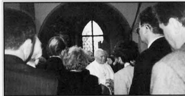
Janez Pavel II. v mariborski stolnici

Različni so vidiki, s katerih lahko razčlenjujemo pomen obiska, ki je lahko pastoralni, državniški in ne nazadnje tudi politični. Nas pa bi tokrat zanimal predvsem versko-kulturni oz. narodni vidik, ki je še kako pomemben pri uveljavitvi Slovenije v evropskem zboru narodov. V zgodovini slovenskega naroda se najverjetneje še ni zgodilo, da bi se slovenska beseda tako uveljavila ne samo doma, temveč tudi v evropskem in svetovnem merilu, kar so omogočili radijski in televizijski prenosi. Samo občudovali smo lahko svetega očeta, ki je vse svoje dolge govore prebral v slovenščini, kar je bistveno prispevalo k njeni enakopravnosti in dostojanstvu tudi v širšem merilu.