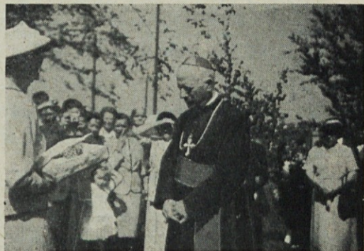
Ko nas je obiskal: Sprejem v Habsterdicku (Francija) l. 1957.

blagoslovi prvo slovensko cerkev v Južni Ameriki. Preprečil je to nov napad boleznin na mehurju. Odjenjalo mu je sicer, a konec oktobra se je znova začelo in zdravniki za to niso vedeli svetovati druge pomoči, kot da poizku-