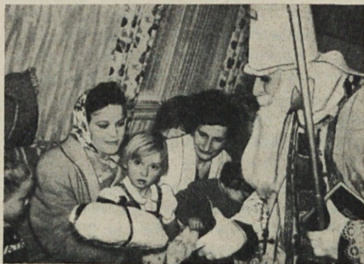
Miklavž med našimi malimi v Porurju.

»Miklavž« je letos nosil v Sterkrade in Osterfeldu. Zaradi pomanjkanja časa je mogel obiskati le nekaj družin. Naše mamicе so svoje »malčke« lepo pripravile na