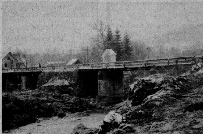
Končno so pričeli z gradnjo Radmirskega mostu. (J. P.)