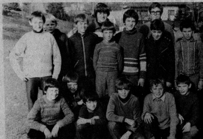
Člani fotokrožka osnovne šole Mozirje

Vse dosedanje ugotovitve narekujejo sklep komiteja ZKS, da se primeri, ki vsled pomanjkljivosti ali zamujanja izstopajo vzamejo posebej natančno v pretres. Najti je treba vzroke, jih odpraviti, da bomo v bodoče dosegli zadovoljivo raven razprav o poslovanju naših kolektivov.