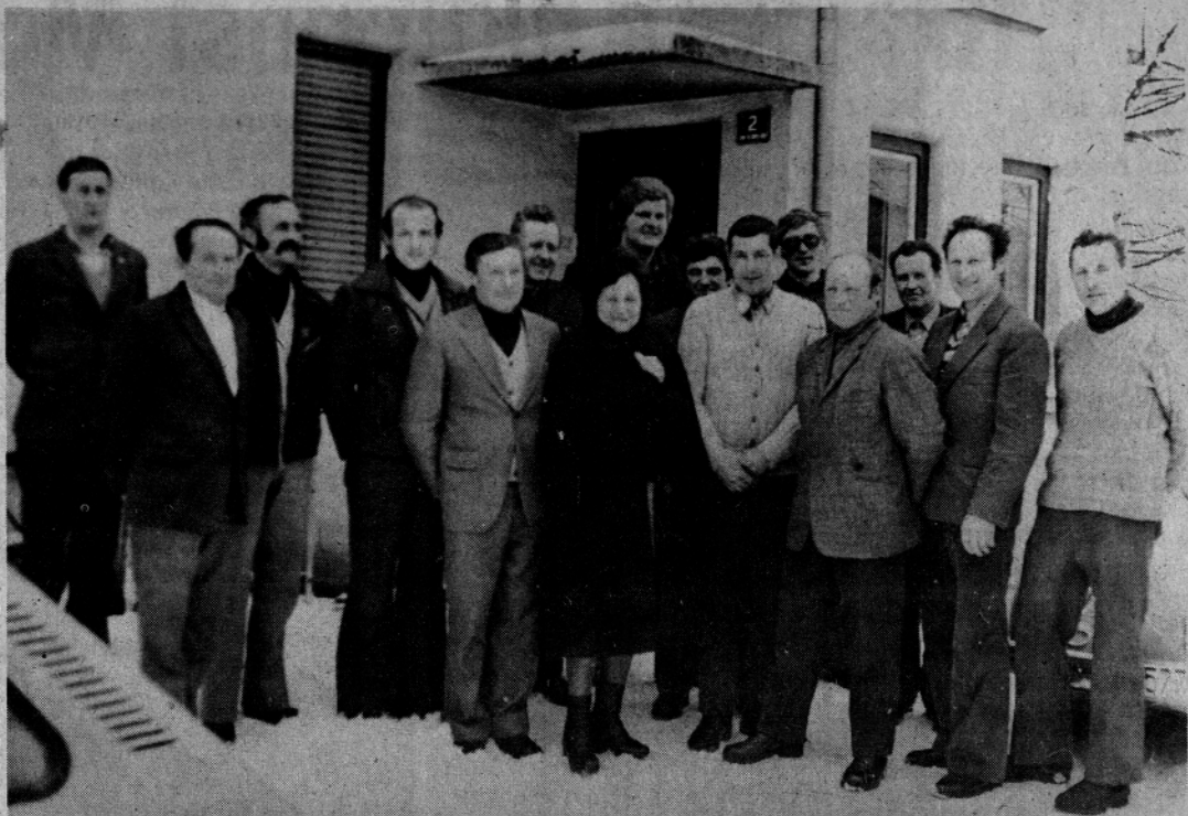
Slovenski vrtnarji so v Mozirju, skupaj s krajski pripravili svojo družabno prireditev v znamenju cvetja. Veseli nas, da so si zopet izbrali Mozirje za svoje srečanje.