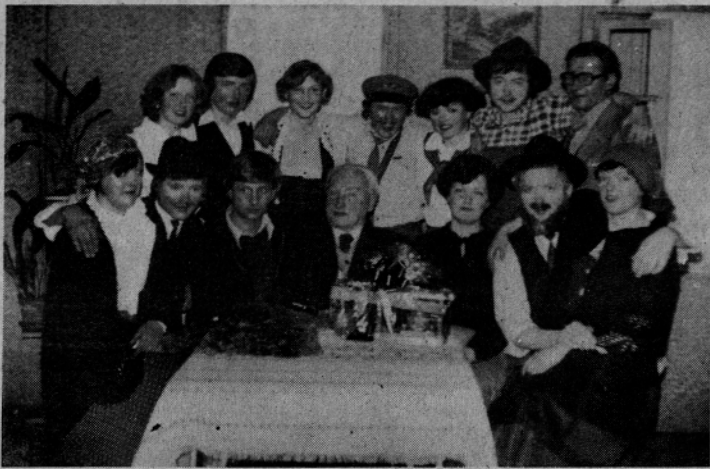
Sodelujoči igralci in kulturni delavci v Novi Štifti