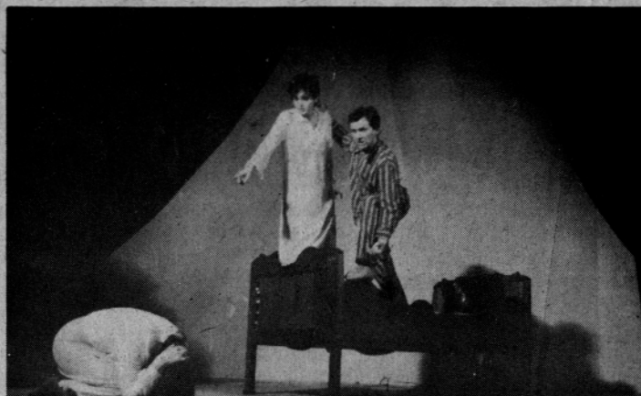
Kaj se je zgodilo družini Slavnič – „Rečiške cime“