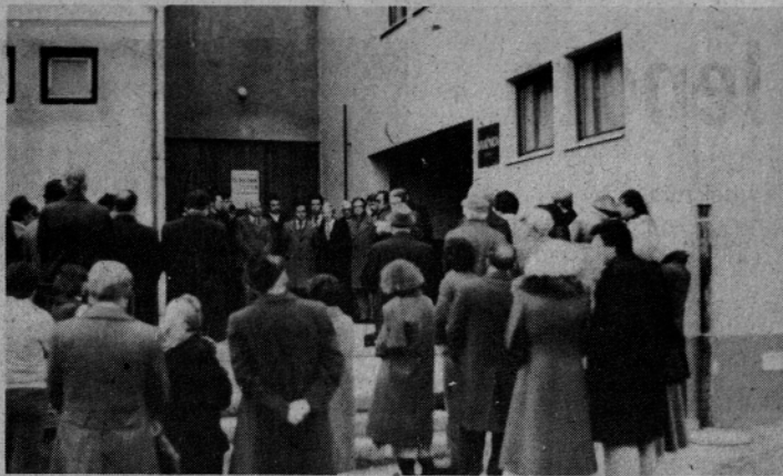
Ob otvoritvi knjižnice v Kulturnem domu v Mozirju (J.P.)