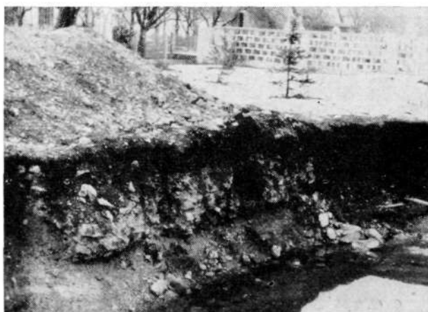
Gradbena jama z masivnim blokom — temeljem v profilu, v ozadju žabniško pokopališče

Tudi v južnem profilu jame je bilo opaziti sledove manjšega zidu, ki je potekal v smeri sever—jug. V izkopanem materialu pa so bili posamezni odkruški tega zidu, ki je bil porušen pri izkopu gradbene jame z bagrom v je-