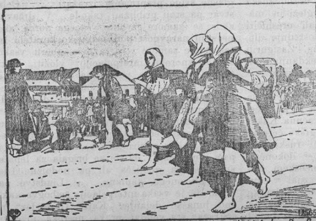
Zum Frieden mit der Ukraine: Wochenmarkt in einem ukrainischen Dorfe.

Prinašamo z ozirom na sklenjeni mir z novo uresničeno ljudsko republiko Ukrajino sliko iz te dežele. Kaže nam tedenski sejem v neki ukrajinski vasi.