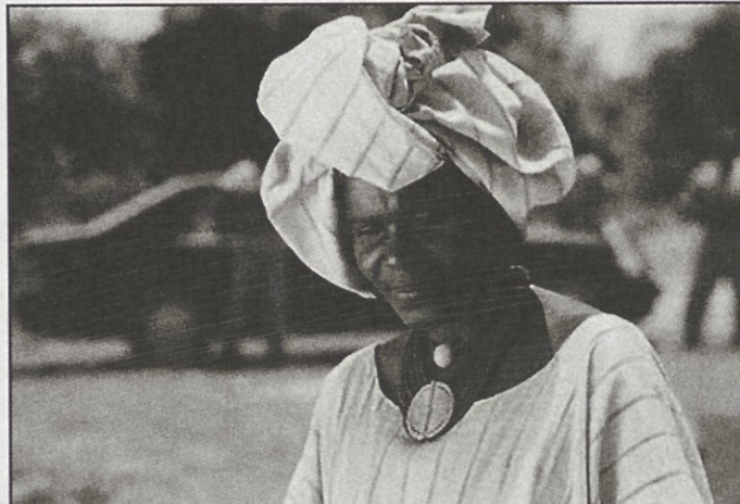
La Nuit de la Vérité