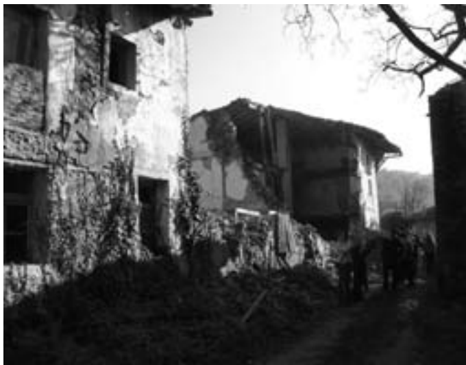
Slika 4, 5: Elementi prostora, ki vse bolj postajajo »razvojna priložnost« – raziskovanje neodkritih prostorov postaja vse bolj značilnost sodobnega turista – raziskovalca (primeri iz Goriških brd).

Figure 4,5: Spatial elements that are becoming "development opportunities" – research of undiscovered places is becoming a modern characteristic of the tourist-researcher (examples from Goriška brda).