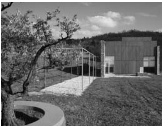
Slika 2: Sodobna ruralna hiša. Novi obrtni kompleks, ki nadaljuje tradicijo krajine v smislu obdelave površin; primer Movia, Ceglo, Goriška brda. Kljub pomanjkanju "fizične" prisotnosti elementov javnega prostora – trga, ulice ... ima kompleks s širšim kontekstom nedvomno pomen javnega prostora v smislu lokalne razvojne priložnosti.