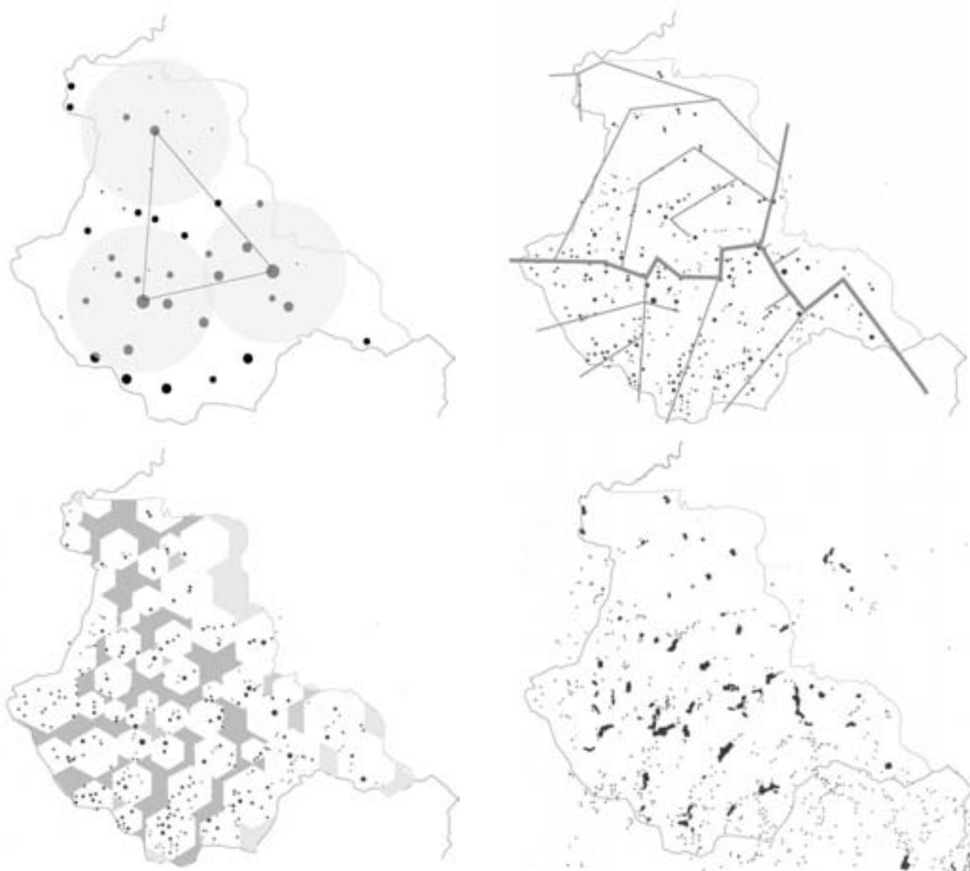
Slika 6: Aplikacija mrežnih modelov na prostor Goriških brd. Pod vplivom združevanja posameznih "pomenskih točk" se je izoblikovala os sever-jug z delnim zamikom (rotirana za 15° v smeri zahoda). To je smer, ki je skoraj pravokotna (zamiki terena) na prometno mrežo in na izoblikovanost slemenskih pomolov. Pravokotno na to smer leži v osrednjem prostoru glavna zgoščitev naselbinskih vzorcev območja, ki se severno in južno redčijo (prelomnica). [vir: Fikfak, 2004].

naselbin oziroma naselij, vasi, zaselkov, samotnih objektov. Za raziskovanje javnih prostorov v odnosu do naselbinske strukture je pomembno, da v to fizično pojavnost vnesemo členitev prostora glede na "jezik vzorcev". Posamezne naselbine in njim pripadajoči vzorci so predstavljali vplivno območje posamezne enote, ki se prek mreže oblikuje in združuje ob prometnih koridorjih. Mreža je sestavljena iz razmeroma regularnih enot; razlike se kažejo predvsem v geografskih pogojih, upravni razvitosti ter konfiguraciji terena (v odnosu do prometnih komunikacij). Med posameznimi enotami se oblikujejo območja praznin, ki so strukturirana kot območja med enotami ob