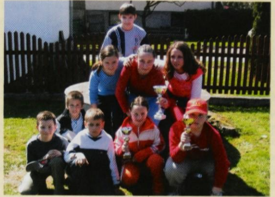
Zmagovalna ekipa starejših pionirk PGD Lukovica

V soboto, 8. aprila, je potekalo tekmovanje mladih gasilcev v orientaciji v organizaciji GZ Domžale. Tekmovanje je bilo v Dobu in v njegovi širši okolici. Iz GZ Lukovica se ga je udeležilo šest ekip. Iz PGD Lukovica tri ekipe, eno so sestavljali mlajši pionirji, ostali dve pa starejši pionirji in starejše pionirke. Iz PGD Krašnja sta tekmovali dve ekipe mlajših pionirjev in ena starejši pionirji. Poleg pohoda na zelo dolgi progi, so imeli tekmovalci še nekaj točk, na katerih so izvajali znanje iz področja gasilstva, narave in športa. Čeprav so naše ekipe tekmoval na nivoju GZ Lukovica, so se uspešno kosale tudi z najboljšimi iz GZ Domžale. Na podelitvi so vsi dobili pokale, najboljši pa so bili ml. in st. pionirji PGD Krašnja in st. pionirke PGD Lukovica. Vse ekipe gredo naprej na regijsko tekmovanje, ki bo v začetku junija v Mengšu. Za zaključek so si vsi prislužili čaj in kupon za sok in pizzo v piceriji Fontana. Želim si, da bi se v prihodnosti tega tekmovanja udeležile tudi druge ekipe gasilskih društev Črnega grabna.