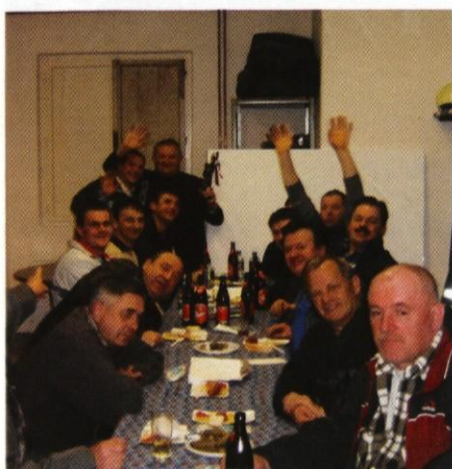
Tudi druženje nekaj šteje!

Sekcije za šport in rekreacijo mislili resno, se lepo vidi iz aktivnosti, ki se dogajajo na tempodročju.