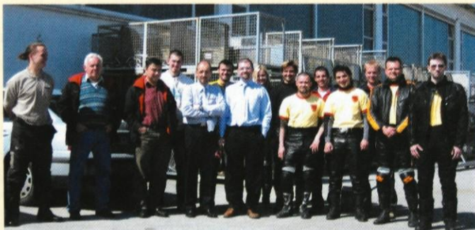
Skupinska slika pred tovarno

Moto klub Rokovnjaci smo se 14. aprila odpravili na obisk tovarne izpušnih cevi AKRAPOVIČ. Njihovi izdelki slovijo po celem svetu in to na področju serijskih kot tudi dirkalnih motociklov. Ker so skupine za ogled omejene, se nas je v okolico Ivančne Gorice odpravilo 14 članov, 11 na motorjih