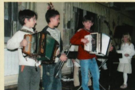
Učenci OŠ Blagovica