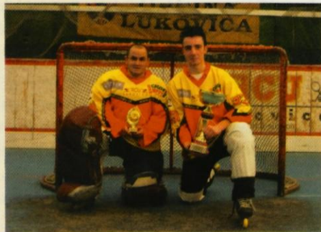
Najboljši s pokalom

V RCU Lukovica se je končala RCU liga v inline hokeju, ki se je igrala od meseca oktobra do konca marca. V ligi se je skupno odigralo 120 tekem in Kocijev memorial. Igral se je najbolj kakovosten hokej, saj so sodelovale najboljše slovenske ekipe. Ekipe HK Prevoje je nastopala s svojimi stalnimi igralci, ki pa so se jim letos že pridružili mlajši in tako dodali dodaten mladostniški naboj. RCU Prevoje