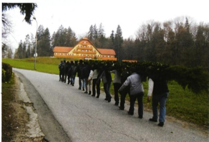
Butara roma proti cerkvi