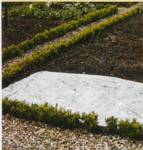
Zaščita mladih rastlin pred mrazom

Vrtnarjeva opravila v maju - veliki traven / 2006