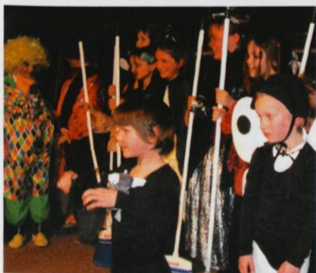
Čira - čara ...

V nedeljo, 2. aprila, so se Krašnjani v podružnični šoli zabavali ob igri Čira-čara, ki so jo pripravili otroci iz OŠ Krašnja (tudi nekaj