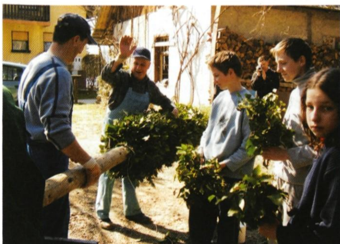
Izdelava butar je velik dogodek

V letu 1992 se nam je porodila ideja o izdelavi velike butare za cvetno nedeljo. Tako smo člani Turističnega društva Preserje pri Lukovici začeli izdelovati butaro, ki pa se je iz leta v leto povečevala. Izdelava butare je za našo vas velik dogodek saj se priprave začnejo že štirinajst dni prej, kjer sodelujejo vsi od najmlajšega pa do najstarejšega člana. Tako letos 2006 naša butara velikanka ob 15-letnici meri kar 25 m. Vsa ta leta butaro velikanko za cvetno nedeljo ročno postavimo ob cerkvi Marije Vnebovzete na Brdu pri Lukovici kar je še posebna zanimivost.