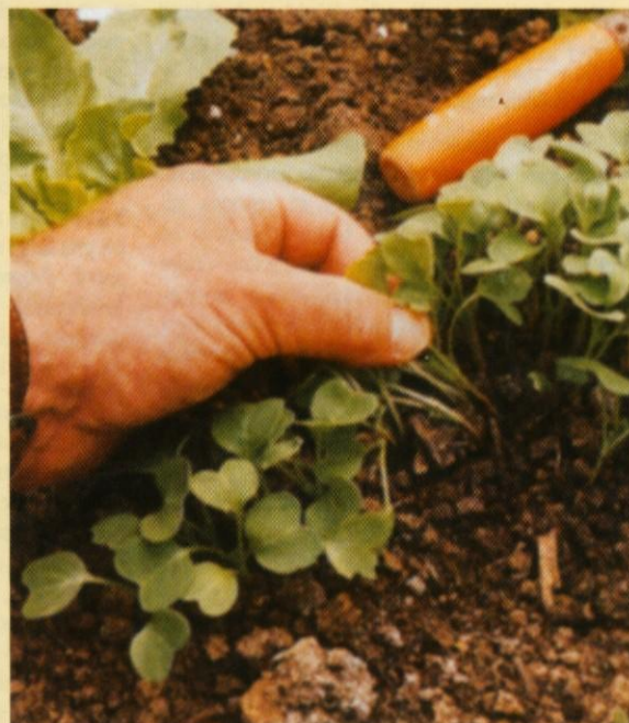
Redčenje pregestih posevkov

Nudimo vam cvetje za vsako priložnost in vam ga tudi dostavimo.