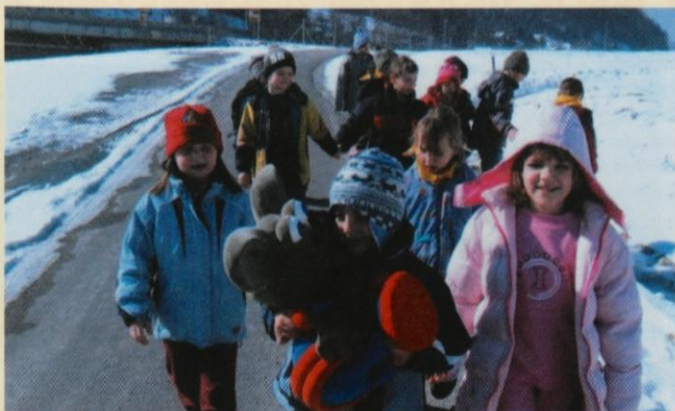
Vesoljček "KAJ" na obisku