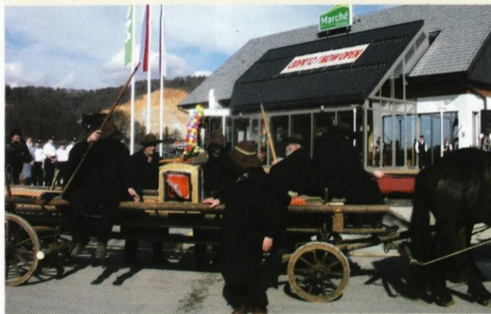
Rokovnjaški voz z blagom