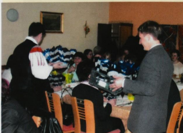
Delili so rožice