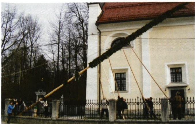
Butaro velikanko je potrebno še postaviti