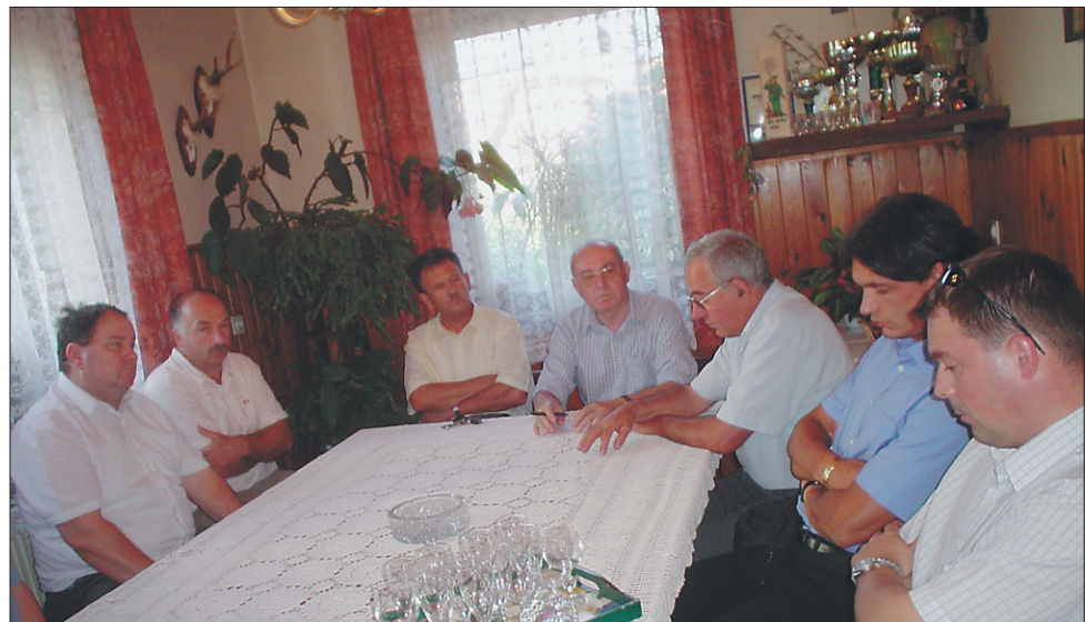
Feri Horvat, predsednik Državnega zbora RS, v pogovoru z domačini.