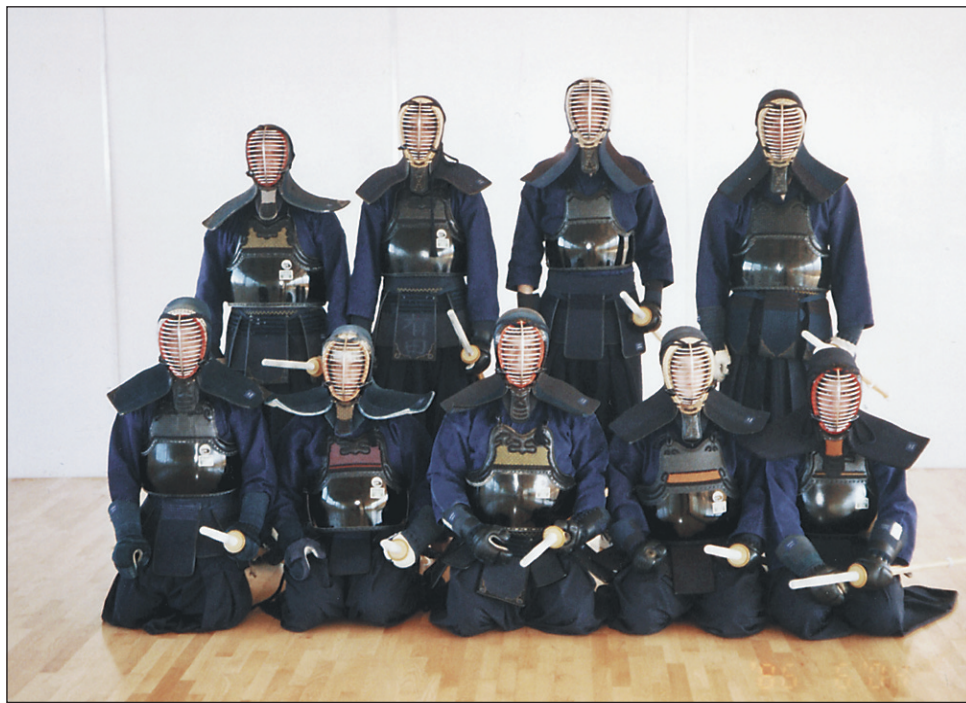
Ptujška skupina mečevalcev (kendo, iai-do) ima devet bogujev (oprem), šteje pa šestnajst članov in članic.