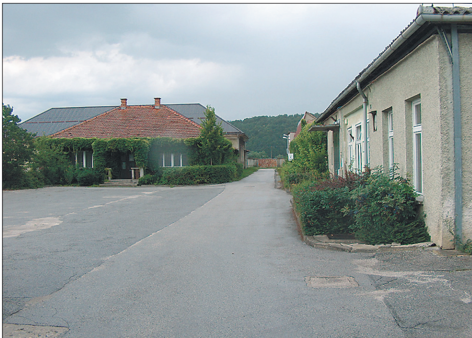
Največja in finančno "najtežja" nerešena zadeva je podjetje TVI Majšperk.