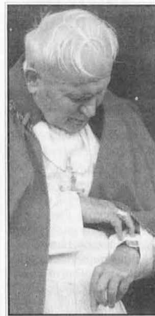
Minilo je veliko časa...

poudarjeno v današnji sveti maši na Vse svete. Duhovnik obstaja zato, da nudi vernikom sredstva, ki jih je dal Kristus, za pot k napredovanju v svetosti... V tem duhu se spominjam let svojega mašništva. Prek spominov na posamezne dogodke in osebe gledam v globino, skoraj bi hotel videti tisto skrivnost, ki me je vodila in obdajala v vseh teh letih. Kot duhovnika me je Kristus poklical, da sem človek Besede, človek Zakramenta, človek »Skrivnosti vere«. Čeprav je minilo že veliko časa, vsak dan vrejo iz mojega srca na dan besede